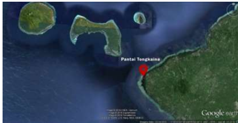
Gambar 1. Lokasi Pengambilan Sampel Alga Merah

isolat bakteri dikarakterisasi berdasarkan pewarnaan gram. Pewarnaan gram dilaksanakan berdasarkan metode Hadioetomo (1993) yakni dengan melihat kemampuan dinding sel bakteri dalam menyerap zat warna kristal ungu dan atau safranin setelah sel bakteri difikisasi pada kaca objek.