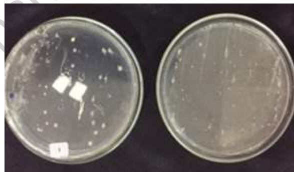
Gambar 2. Bakteri simbiosis alga merah yang tumbuh pada media agar

alga merah mirip Gracilaria sp. berjumlah 5 isolat juga. Masing-masing isolat bakteri memiliki karakteristik morfologi yang berbeda dan dapat dilihat pada tabel 1. Karakteristik koloni bakteri yang diamati meliputi bentuk, warna, elevasi, dan tepian (Dwijoseputro, 1989).