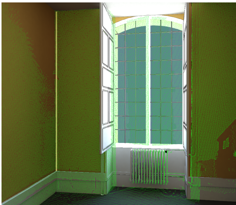
Figure 1. Affichage de 2 calques simultanés : maquette actuelle et scan laser

L'importante modularité des calques autorise l'utilisateur à visualiser la ligne du temps d'avancement de son projet. Tout projet d'envergure possède un planning auquel il est primordial d'avoir accès afin de programmer les actions à mettre en place pour respecter le temps imparti à la réalisation des travaux. Ces prévisions sont généralement mises en place sur un support informatique ; nous prenons parti de cet avantage en liant cette donnée aux éléments des maquettes numériques. Grâce à ce lien, il est possible de visualiser des états intermédiaires des travaux et d'évaluer l'avancement correct du chantier par simple comparaison au modèle virtuel.