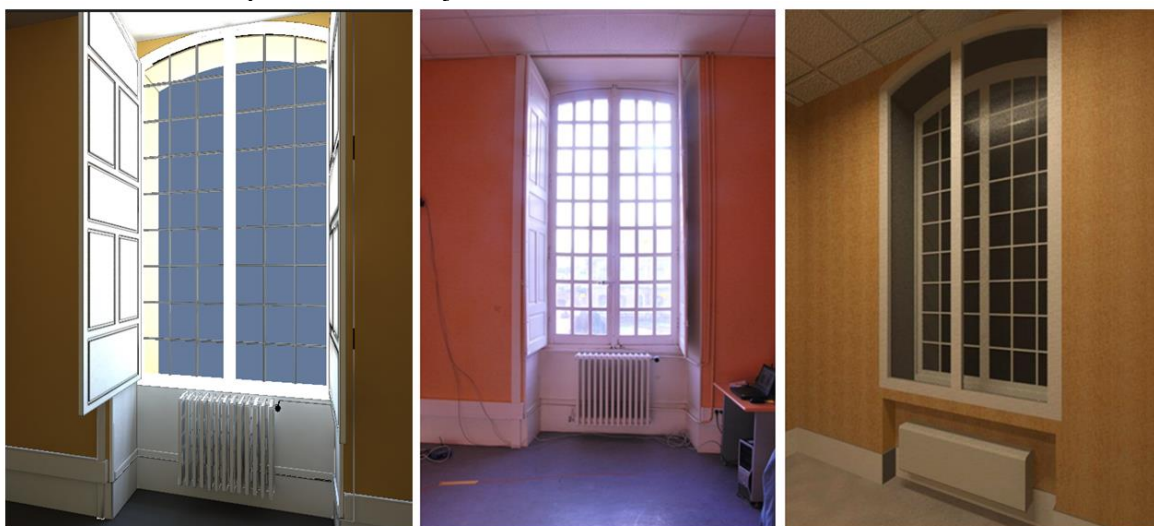
Figure 2. Maquette de l'état actuel, photo de l'état actuel et maquette après rénovation

Le travail effectué est appliqué à l'école d'ingénieurs Arts et Métiers Paristech de Cluny. Le bâtiment occupé par cette école est une ancienne abbaye clunisienne datant du dix-huitième siècle. Ces locaux souffrent aujourd'hui de défauts d'isolations thermiques. Les travaux de tests se sont concentrés à décrire la rénovation d'une pièce de cette enceinte afin de valider l'efficacité de la rénovation avant de l'élargir à l'ensemble du bâtiment. Plus exactement, la rénovation concerne une grande baie vitrée. L'édifice étant un bâtiment historique, il est impératif de conserver l'état extérieur en réalisant l'isolation par l'intérieur : ajout d'une cloison intérieure surmonté d'une nouvelle baie.