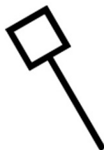
Mazo de Gran Casa