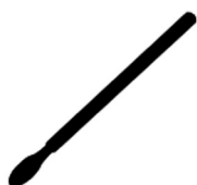
Baqueta de madera