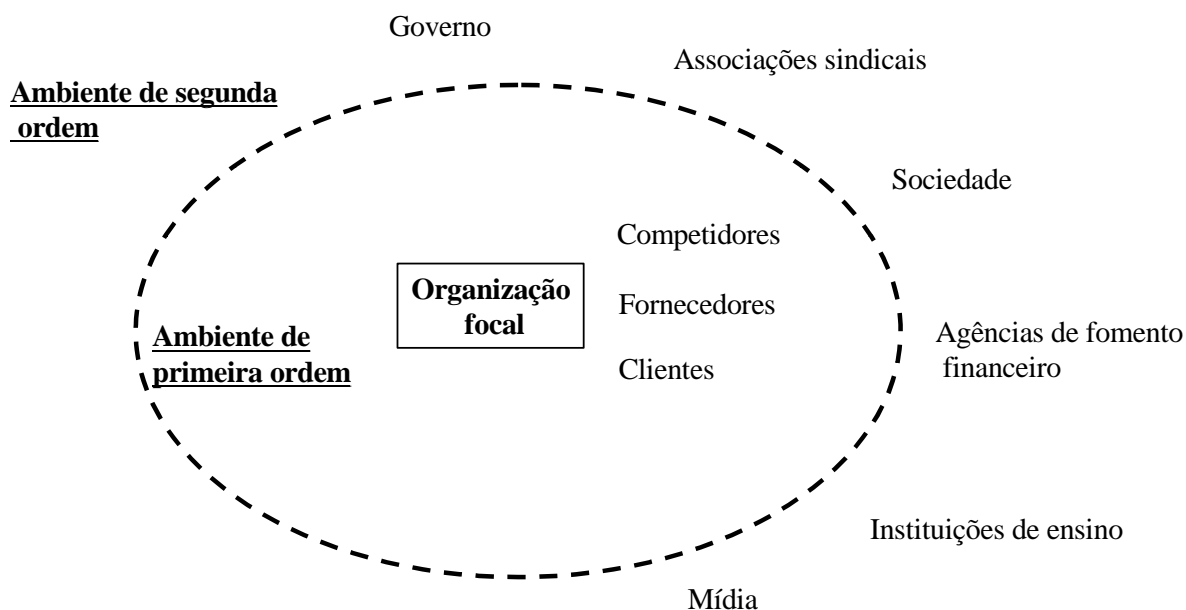
Figura 1 – Perspectiva de ambiente organizacional

A figura que se segue visualiza a perspectiva de ambiente organizacional – de primeira e segunda ordem – de Emery e Trist (1965).