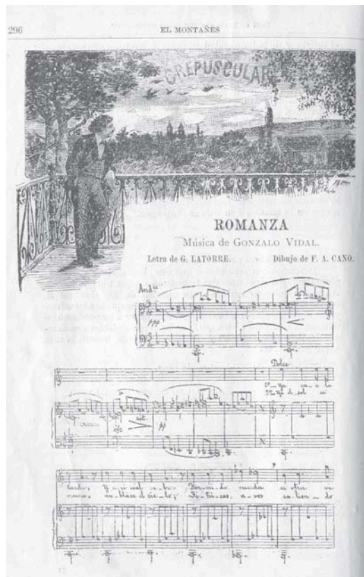
F.A. Cano, Crepuscular. En: El Montañés , N.7, Medellín, 1898, p. 296.

En cuarto lugar, esta investigación ha concluido también que la vida de un hombre permite hablar de una ciudad, de una región o de un país; pero igualmente de mucho más que eso: permite razonar sobre las conexiones entre las ciudades, las regiones y los países, sobre los problemas de fondo que unen a quienes aparecen desligados y aislados. Las pequeñas ciudades como Yarumal, con 6.000 habitantes en 1880, y