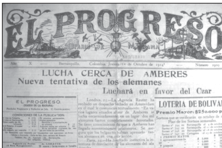
El Progreso. Periódico de Barranquilla, 1914. Biblioteca Nacional de Colombia, Hemeroteca, Bogotá.

con el fin de conocer el estado del arte más allá de los ámbitos locales y abrir este trabajo a una perspectiva comparativa. El contexto académico en el que se realizaba la investigación permitía consultar fuentes, tanto en los archivos colombianos como en los europeos, y discutir los resultados con investigadores latinoamericanistas. 11