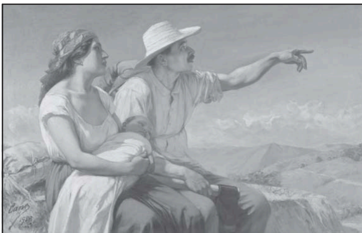
F.A. Cano. Horizontes , óleo sobre lienzo, 1913, 93 x 150 cm., Museo de Antioquia, Medellín.

bajo el manto romántico de una familia blanca y campesina, la expresión apoteósica de la representación de sí mismos. En otras palabras, el contexto de las dos primeras décadas del siglo XX permitió que la pintura, la fotografía y la música se tornaran en la vía más expedita para luchar contra la “barbarie” en favor de la “civilización” y la “raza antioqueña”.