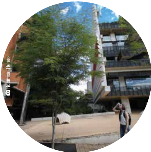
Zona 4 Ébano endémico