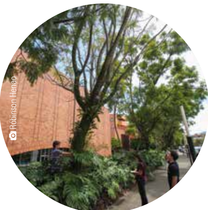
Zona 6 Búcaro