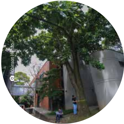
Zona 7 Caracolí