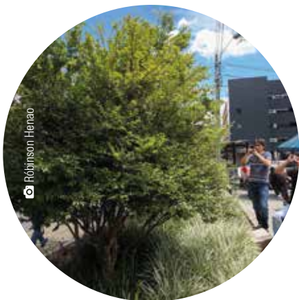
Zona 8 Muli