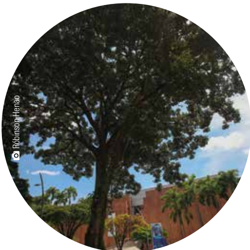
Zona 5 Gualanday nativo-Endémico