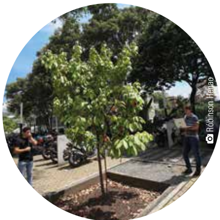
Zona 1 Manzano de monte