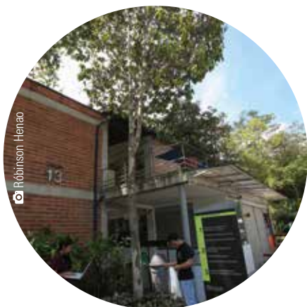
Zona 2 Varasanta