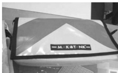
図 2. MAKTANK 工房製作バッグ

太陽工業枚方工場内に、テント膜の未利用繊維（裁ち落とし部分）と、テントや工場用袋として一度使用したものを回収したりサイクル素材を活用してオリジナルバッグを製作する MAKTANK 工房がある。主にホームページ掲載によって、図 2 に示すような 1 点物のバッグを販売することで、廃材を有効活用する取組みが進められていた。