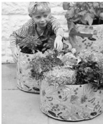
図5. ベジパティオプランター ポリエチレン製 イギリス Haxnicks 社

図5のような園芸用ビニルプランターや布プランターは、海外のガーデニング用品には種類も多く、昨今では国内でも見られるようになってきた。布製プランターは、栽培する植物の大きさや丈に合わせて選び、複数を組み合わせて置くことで狭いスペースでも有効に使える利点がある。小さなものは軽くて、ハンギングもしやすい。また、不要な時は畳んでしまえる利点もある。町中を観察すると、市販のビニル製や布製プランターを使わずに、ショッピングバッグや土袋をプランターとして代用する家庭も見られる。