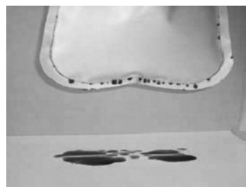
図4. 袋1本地縫い（U字形）