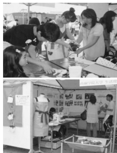
図 14. テント膜の活用展示と花用ポットの製作体験、エコフェスタ出展ブース、2011 年 9 月、仙台勾当台公園