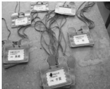
図 12. 家庭用ミシンによる縫製

園芸用エプロンのポケット部分など、通常の布なら簡単などころも、以上の様な独特な工夫が必要であり、試作したことで、正確に作る技術を習得できた。