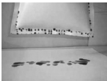
図3. 袋2本地縫い（四角形）

図3～4に水漏れが始まった直後の写真を示した。1000mLの水を袋に入れ1～5秒の間に、いずれの縫い方の袋からも、しみ出るような状態で水が漏れ始めた。漏れ始める時間は四角形は1～3秒、U字形は4～5秒であり、U字形がやや遅かったが、大きな差はなかった。1本縫いより針穴が多い2本縫いの方が漏れ初めの時間は早く、プランターの底をミシン縫製すれば排水効果が得られることを確認した。