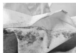
図9. 縫製部分の糸切れ