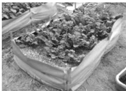
図10. 畑の土盛りの囲い（改良型）

劣化して壊れた囲いを改善する別の方法として、力がかかる部分は縫製しない形態を考え、デザインすることにした。図10の改良し製作した囲いのサイズは幅70×長さ140cmとコンパクトにして、製作から設置作業まで扱い易い程度の高さに変えた。