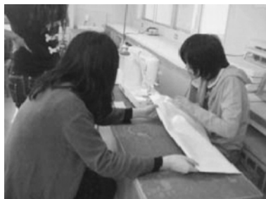
図11. 職業用ミシンによる縫製