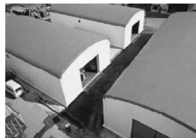
図1. テント膜 (太陽工業 HP より引用)

ここでは、工場の生産段階で排出される屑布、具体的には、太陽工業株式会社枚方工場より出されたテント膜（図1）繊維廃材を用いた。屋外構造物に使用されるテ