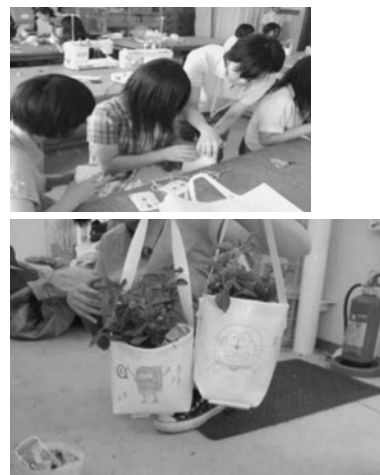
図 13. 花用ポットの製作体験、大学オープンキャンパス、2010 年 7 月