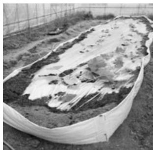
図8. 畑の土盛り囲い

図8の畑の土盛り用の囲いは、幅 700 × 長さ 1000 × 高さ 40cm サイズで最初に試作したものである。大学キャンパスのビニルハウス内に設置し、園芸学実習の授業で2010年6月から2011年8月まで使用した。