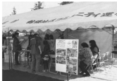
図15. 花用ポットの製作体験、2013年11月、名取市仮設住宅

図16は試作したライトだが、テント膜素材には光を透過する性質があり、裏側に描いた絵を表面に浮き上がらせることができる。このような面白い効果も発見できた。熱に強い素材なので、今後、ガーデンライトに活用する検討もしていきたい。