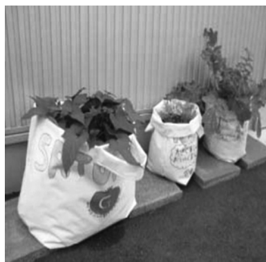
図6. 園芸用プランター 左：幅 50 × 奥行 30 × 高さ 50cm 中：幅 25 × 奥行 25 × 高さ 45cm 右：幅 35 × 奥行 35 × 高さ 65cm

図6がテント膜廃材から試作したプランターで、さつまいも、人参、大根用の3種のプランターを製作した。大根用（右）は成長に合わせて上部の折り返しを延ばせる形にした。試作した結果、大型になると移動するための持ち手の補強が必要だが、テント膜では何枚も重ねた厚地の縫製が難しく、持ち手を付けた箇所が使用中に破損してしまっ