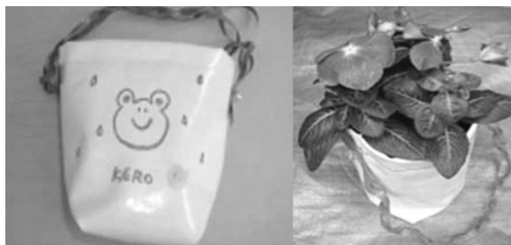
図7. 花用ポット（持ち手も廃材利用）

小型の花用ポットは持ち手付でハンギングできる形とし、数種類を作った。図7は、持ち手もテント膜廃材を編み込んで作ったタイプである。上記の実験で確認したように、底部・側部に縫製部分があるので、適度に水滴が落ちていく。