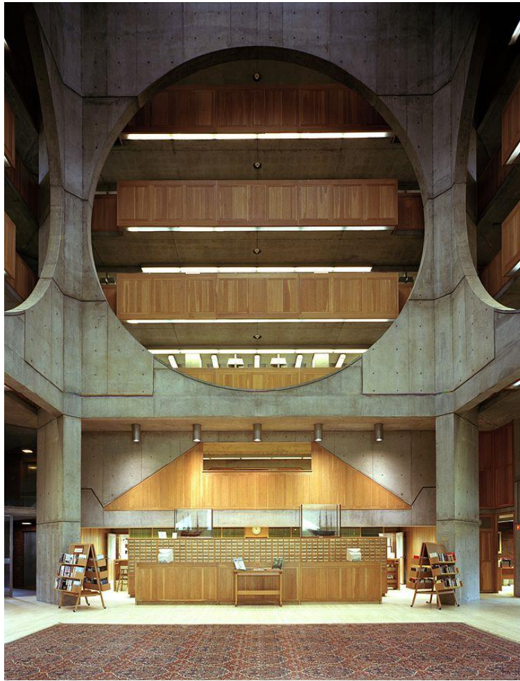
Figura 4. Zona central de la Biblioteca Exeter.

La forma determina el uso y la función; y la función y el uso también determinan, de forma sucesiva, la forma que tendrá un determinado espacio. El material y la forma se interrelacionan el uno con la otra, para acabar fusionándose de forma absoluta y total. Y es que nada podría existir sin el otro (Kohane, 1989, p. 101). En efecto, el espacio central es un pequeño compendio de orden y de lógica geométrica; estos conceptos para Kahn eran muy importantes, y los cogió de la arquitectura renacentista, dónde los edificios eran una representación a pequeña escala de algo armónico, bello, perfecto e incluso divino (Kohane, 1989, p. 109); este renacentismo, transformado ahora en un clasicismo moderno en manos de Kahn, se aprecia claramente en las líneas de la Biblioteca. Además, para Kahn las bibliotecas era una tipología superior de edificios: eran una puerta de acceso a la cultura, a un estadio superior para el hombre, y todo mediante la lectura. De esta manera, el contenedor de libros (visible desde la escalera), el vestíbulo de acceso y la zona interior representan simbólicamente esta ascensión cultural (Gil Solés, 2006).