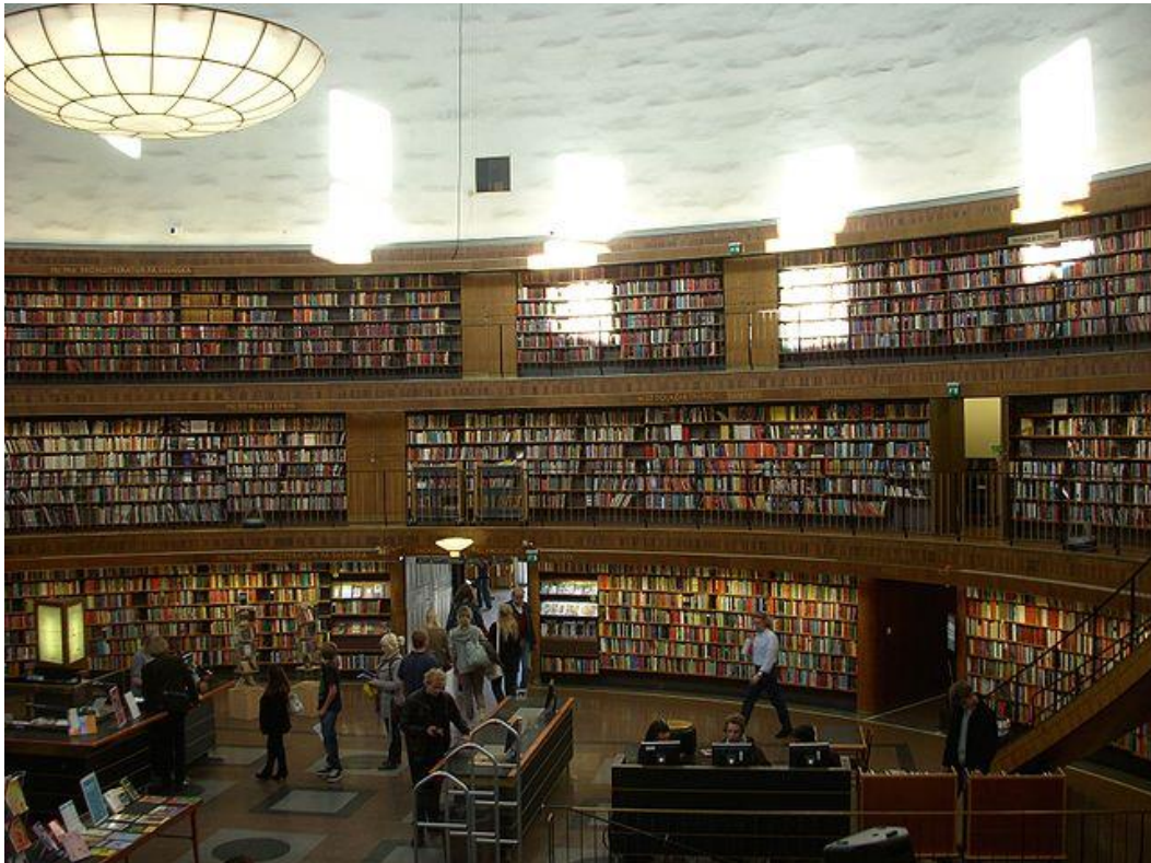
Figura 2. Interior de la rotonda de la Biblioteca Pública de Estocolmo. Autor: Holger Ellgaard. Fuente: Wikipedia

para adultos, para el personal de la biblioteca y para los niños. Para finalizar el texto sobre la biblioteca de Gunnar Asplund, y a modo de curiosidad, hacer una pequeña mención al presupuesto de su construcción que “fou de 2.200.000 coronas sueques de l'època, proporcionat per la Fundació Wallenberg, el Fons Forsgrenska i el Fons Danelius. A més, l'Ajuntament d'Estocolm donà 102.000 coronas per a les catifes i els prestatges; i 180.000 coronas més per als mobles, làmpares i altres accessoris.” (Gil-Solés, 2009, p. 3)