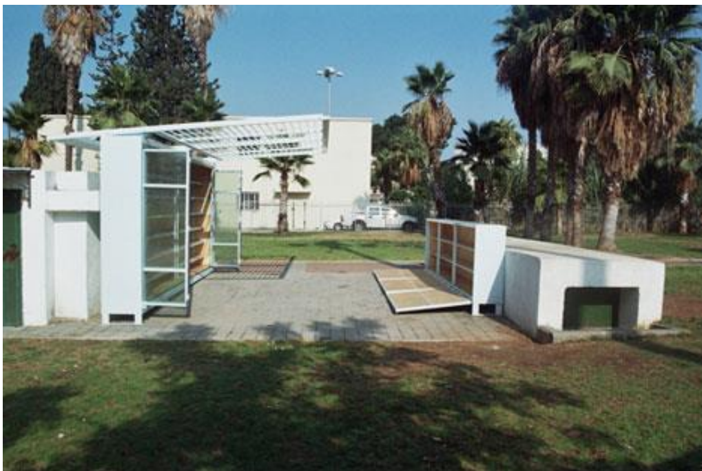
Figura 8. Levinski Garden Library. Autor: Yoav Meiri Architects.

individual, que permita una relación más profunda y humana entre estas tres aristas del triángulo: un espacio íntimo, individual y sin condicionantes externos, minimalista y concentrado; la persona, que tiene al alcance un fondo reducido, seleccionado y único, y que permite la focalización, la concentración y la no dispersión; y finalmente, una experiencia lectora y de conocimiento más fluida, más directa y menos mediatizada, dónde lector, libros y espacio confluyen. Una propuesta, por otro lado, que se podría aplicar también con los centros de interés, creando así también espacios de interés, y completando así una experiencia redonda, cerrada y llena.