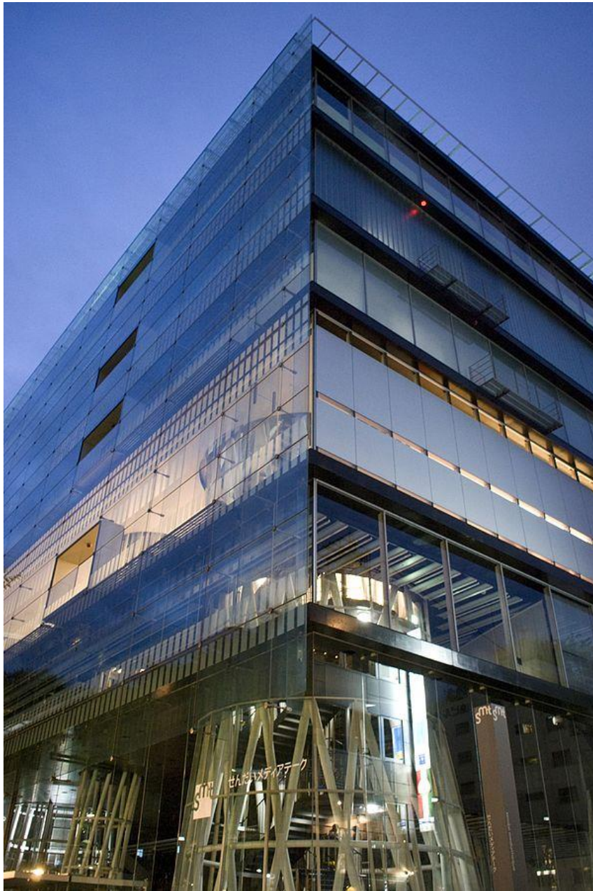
Figura 5. Mediateca de Sendai.

Más allá de su aspecto físico o de su forma (dónde destacan especialmente los 13 tubos que atraviesan verticalmente todo el edificio y que sirven para la canalización de las comunicaciones interiores del edificio: cableado, líneas telefónicas y también personas), lo realmente interesante y que hace única a la Mediateca de Sendai es la concepción que Ito quiso dar al edificio, y que lleva implícita una filosofía totalmente disruptiva: “(...) Pronto comenzamos a describir el edificio como un “autoservicio de media”. Lo único que queríamos decir con esto era que almacenaría diferentes media, tales como publicaciones, videos, películas, cuadros y arte electrónico, de la misma manera que un supermercado almacena diferentes productos en las estanterías (...)” (Ito, 2001). Esta