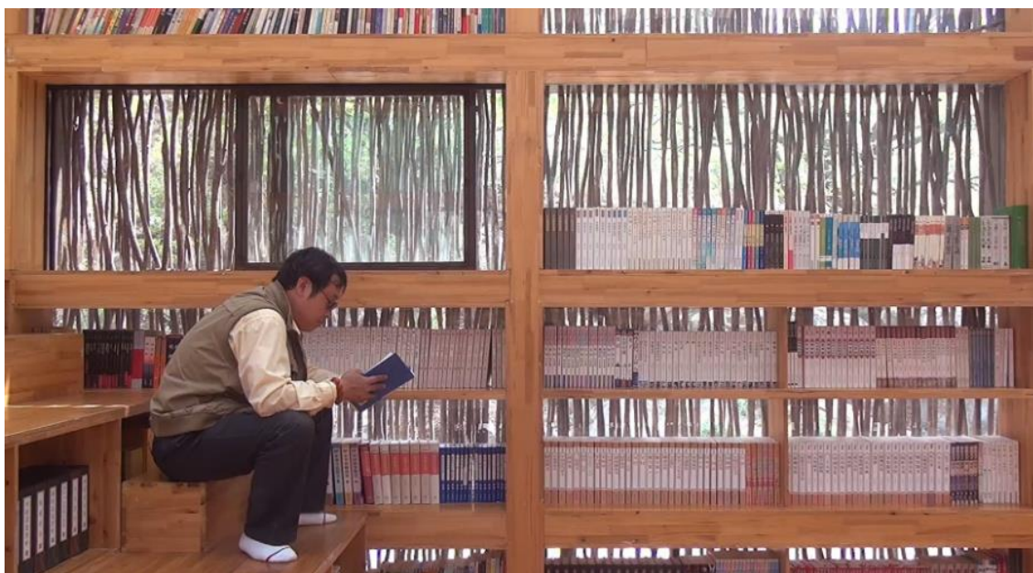
Figura 7. Biblioteca de Liyuan. Autor: Li Xiaodong.

singulares en aquellos tiempos, son una muestra importante del interés de la ciudad en difundir la lectura, un interés que en la actualidad se ve reflejado en los diferentes modelos de bibliotecas al aire libre que, felizmente, llenan nuestros espacios de ocio al aire libre” (Mañá Terre, 2018).