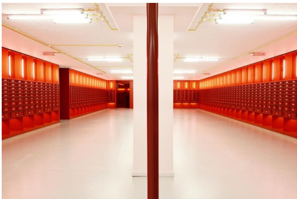
Figura 6. Habitación roja de la Biblioteca de la Universidad de Amsterdam. Autor: Diane. Fuente: Dianewantstowrite.com