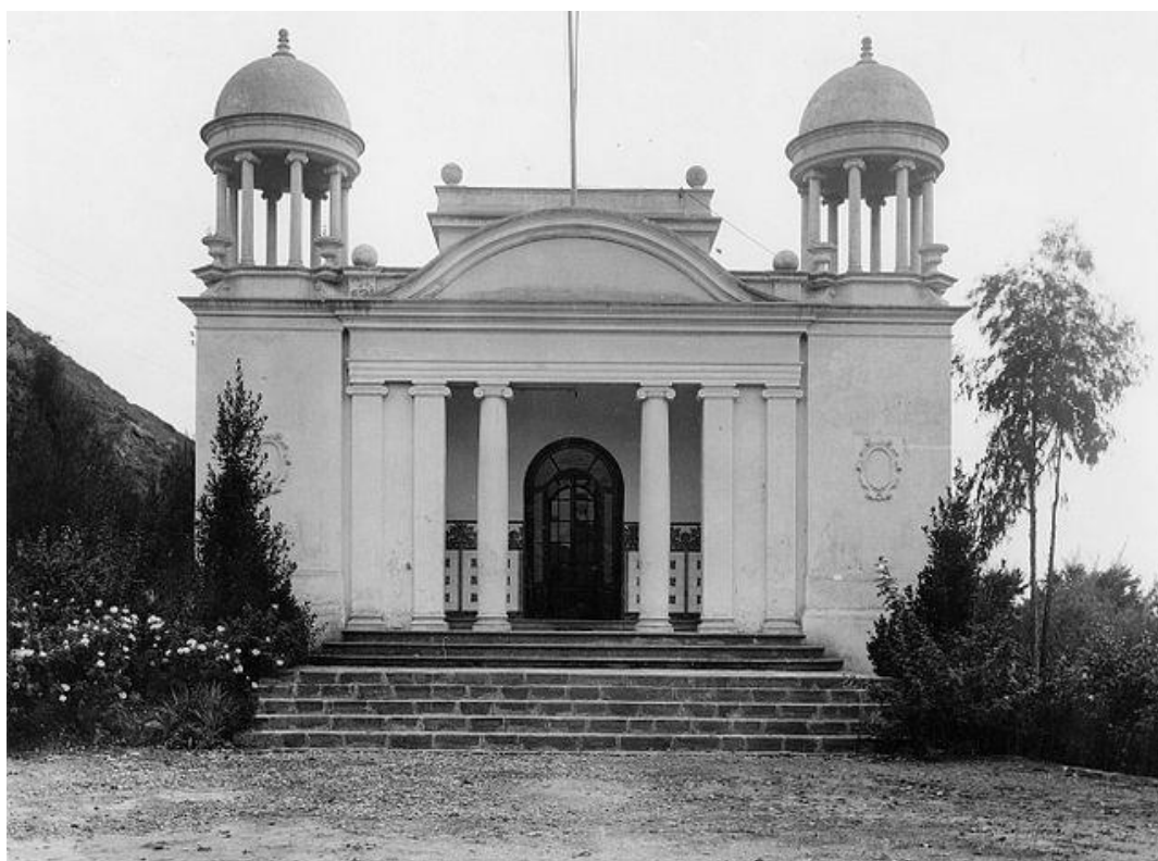
Figura 1. Fachada de la Biblioteca Popular de Sallent. Fondo fotográfico de la Biblioteca Sant Antoni Maria Claret de Sallent. Fuente: Wikipedia

Así pues, la herencia de una concepción neoclásica de los edificios perduró con la Mancomunitat: los edificios se concibieron como auténticos templos simbólicos del orden, la luz y la higiene, que diesen un vuelco absoluto al panorama bibliotecario catalán de la época, y que “debían ser el símbolo de la nueva Catalunya, que dejaba atrás un pasado de telarañas, pereza y moho, para poder, por fin, empezar a reconstruirse a sí misma” (Navarra, 2018, p. 180). De esta manera “este emplazamiento refuerza la imagen (...) de la biblioteca como un templo de cultura al cual hay que peregrinar (...). Los edificios no podían ser ni espectaculares ni ampuloso a causa de los costes, pero eran edificios emblemáticos; conseguían atraer por la elegancia y el aspecto clásico que les daba un aire de nobleza, una imagen que perduró a lo largo de los años y que los identificó” . (Mañà Terré, 2010, p. 52). El impulso regeneracionista de D’Ors fue total, con una visión global del edificio de la biblioteca, y en el que insistía de forma obsesiva que debían ser edificios de nueva planta, sin aprovechar edificios ya existentes, algo que por entonces estaba muy de moda. De esta forma, “la biblioteca orsiana es un edificio exento, concebido como un templo de lectura, bullendo de actividad mental, aireado, gestionado por mujeres cultas y audaces, madres de la alfabetización y la educación para adultos” (Navarra, 2018, p. 180).