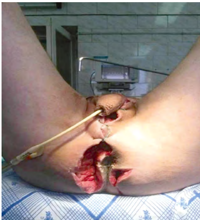
Рис. 3. Пациент С., 46 лет. Этапная хирургическая обработка гнойного очага — удалены некротизированные ткани мошонки с перемещением яичек под кожу по внутренней поверхности бедер Fig. 3. According to histopathological examination of biopsy material it is viewed tissues necrosis with polymorphic cell infiltration, multiple thromboses and vascular congestion of microcirculatory bloodstream in microslide

коррекцию метаболических нарушений и иммунного статуса, а также стимуляцию репаративных процессов в ране.