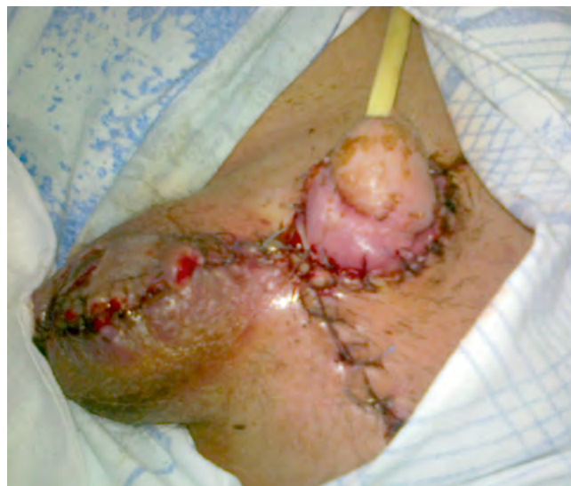
Рис. 4. Произведена кожная пластика с перемещением правого яичка в мошонку. На фото представлен вид раны после наложения вторичных швов

Хирургическая обработка гнойного очага включала широкое рассечение кожи с иссечением всех нежизнеспособных тканей и оболочек мошонки, передней брюшной стенки, перемещение яичек под кожу по внутренней поверхности бедер (рис. 3). В последующие 12 суток были выполнены еще три хирургические обработки с ревизией ран и этапными некрэктомиями. В связи с развитием гнойно-некротического орхоэпидидимита произвели левостороннюю орхэктомию. В фазе гидратации для местной санации раны использовали антисептический раствор гипохлорита натрия 1200-1300 мг/л, 3% раствор борной кислоты, «Репарэф-1», растворы йодфоров (0,5-1% йодопирон, повидон-йод, «Йодискин») и мази на полиэтиленгликолевой основе («Меколь»). В целях ускорения отторжения гнойно-некротических масс и очищения ран использовали растворы протеолитических ферментов («Трипсин» и «Химопсин»).