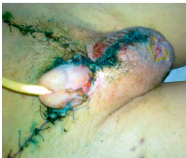
Рис. 5. Внешний вид мошонки перед выпиской из стационара Fig. 5. The appearance of scrota before the discharging from the hospital

Fig. 4. Skin grafting was done with the right testicle remigration to the scrota. In the photo - the appearance of the wound after secondary suture