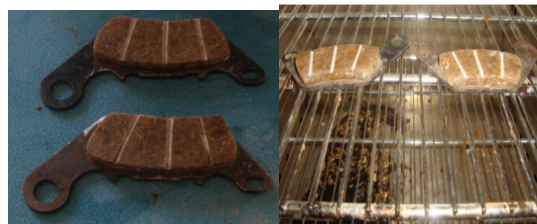
Gambar 13. Pemanasan dengan menggunakan oven