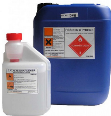
Gambar 2. Resin polyester dan hardener