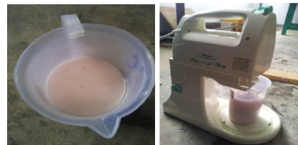
Gambar 5. Resin polyester dan alumina ditambahkan 1% berat katalis