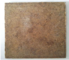
Gambar 9. Panel biokomposit yang telah selesai dicetak

Tahapan ketiga, pembuatan kampas rem dengan bahan biokomposit polimer serat dengan pengisi alumina dengan langkah-langka sebagai berikut: