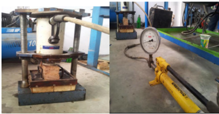
Gambar 8. Pencetakan dengan tekanan hidrolik