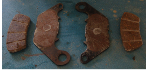
Gambar 11. Biokomposit kampas rem