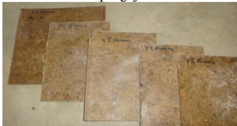
Gambar 10. Biokomposit polimer serat fraksi volume serat 30%, dengan penambahan berat alumina 0, 3, 5, 7, dan 9%