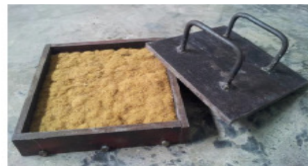
Gambar 6. Serat kulit buah pinang dimasukkan dalam cetakan