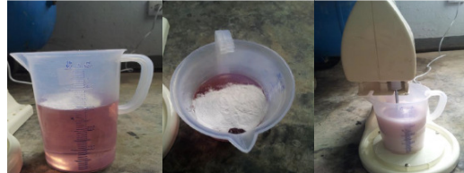
Gambar 4. Proses pencampuran resin polyester dan serbuk alumina