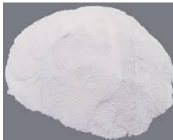
Gambar 3. Bahan pengisi Al_2O_3 (serbuk alumina)

Tahapan kedua, pembuatan biokomposit polimer serat dengan pengisi serbuk alumina untuk aplikasi kampas rem dengan prosedur sebagai berikut: