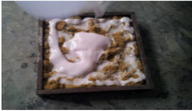
Gambar 7. Campuran resin, alumina dan katalis ditirkan kedalam cetakan