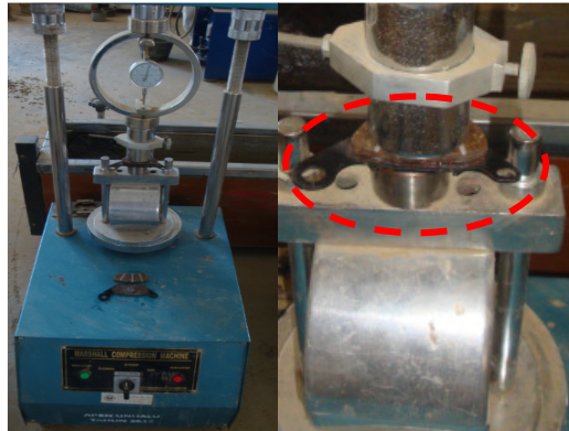
Gambar 12. Pemasangan kampas pada lempeng dukungan