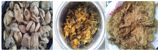
Gambar 1. Proses perlakuan dan perendaman serat 5% NaOH selama 1 jam.