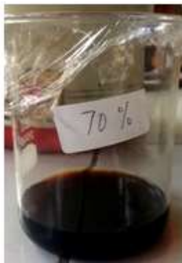
Gambar 1. contoh hasil maserasi dengan konsentrasi pelarut 70%

Dari data hasil analisa persentase rendemen minyak atsiri akar bunga anggrek yang dilakukan terhadap variasi konsentrasi pelarut maserasi-ultrasonik menunjukkan bahwa pada waktu maserasi 24 jam dan waktu ultrasonik 10 menit pada konsentrasi pelarut etanol 70% diperoleh rendemen minyak atsiri 18,1%, pada waktu maserasi 24 jam dan waktu ultrasonik 10 menit pada konsentrasi pelarut etanol 80% diperoleh rendemen minyak atsiri 9,55%, pada waktu maserasi 24 jam dan waktu ultrasonik 10 menit pada konsentrasi pelarut etanol 85% diperoleh rendemen minyak atsiri 5,9%, pada waktu maserasi 24 jam dan waktu ultrasonik 10 menit pada konsentrasi pelarut etanol 90% diperoleh rendemen minyak atsiri 2,4%, dan pada waktu maserasi 24 jam dan waktu ultrasonik 10 menit pada konsentrasi pelarut etanol 96% diperoleh rendemen minyak atsiri 2,3%.