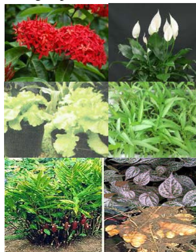
Gambar 8. Tanaman hias (soka, spatifilum), tanaman sayuran (selada, kangkung), dan tanaman rempah/herbal (jahe, sirih merah).

pekarangan produktif dan dalam pengembangan lanskap produktif lainnya. Tanaman hias tergolong tanaman yang paling mudah perawatan, karena mudah tumbuh, sebagian tanaman tidak memerlukan banyak sinar matahari dan tidak mudah terserang hama penyakit tanaman. Tanaman hias sirih gading, spatifilum, maranta dapat hidup di ruang teduhan. Tanaman hias lainnya seperti melati, soka, alamanda, bugenvil dapat menambah estetika dengan keindahan bunganya. Tanaman sayuran, dan rempah/herbal (Gambar 8) sangat penting diterapkan untuk pekarangan produktif. Pemeliharaan intensif seperti penyiraman, pemupukan, pencegahan hama penyakit dan penggemburan tanah sangat penting dilakukan secara berkala untuk kesuburan dan keindahan tanaman. Tanaman sayuran, rempah/herbal dan buah yang tumbuh baik, sehat dan dirawat sesuai dengan karakteristiknya dapat meningkatkan estetika pekarangan dengan penataan dan perencanaan lanskap produktif. Tanaman sayuran seperti tomat, cabe, kangkung, bayam, selada, dan tanam herbal/rempah seperti jahe, laos, kunyit dapat meningkatkan pemberdayaan pekarangan produktif.