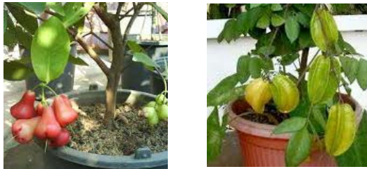
Gambar 9. Tanaman buah dalam pot (Tabulampot) : jambu air, belimbing

Alternatif tanaman buah untuk pekarangan diantaranya jambu air, jambu biji, pepaya, belimbing, tomat, lengkeng, mangga, rambutan, dan sebagainya.