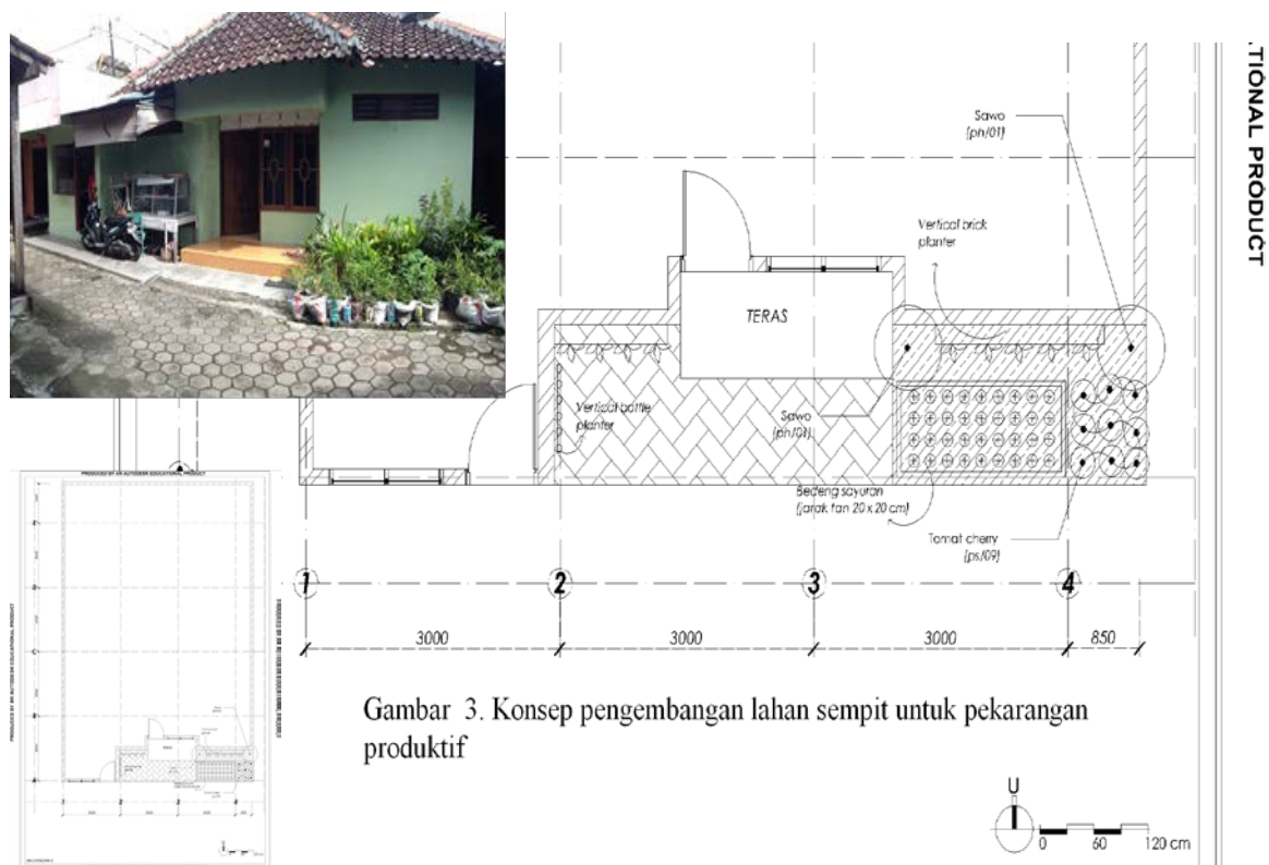
Gambar 3. Konsep pengembangan lahan sempit untuk pekarangan produktif

pekarangan produktif perkotaan, khususnya lahan sempit (20-50 m 2 ) dan sangat sempit (kurang dari 20 m 2 ). Konsep pengembangan pekarangan dengan penanaman vertical ( vertical planting ), penggunaan wadah tanam/pot ( plants container ), dan tanaman merambat dengan pergola, dapat dilakukan dengan melakukan inovasi terhadap pemanfaatan ruang, teknik pelaksanaan/konstruksi yang mudah, pemanfaatan bahan bekas/ daur ulang, sehingga konsep ramah lingkungan dan layanan ekosistem dalam perwujudan lingkungan binaan berkelanjutan dapat dilaksanakan dengan baik.