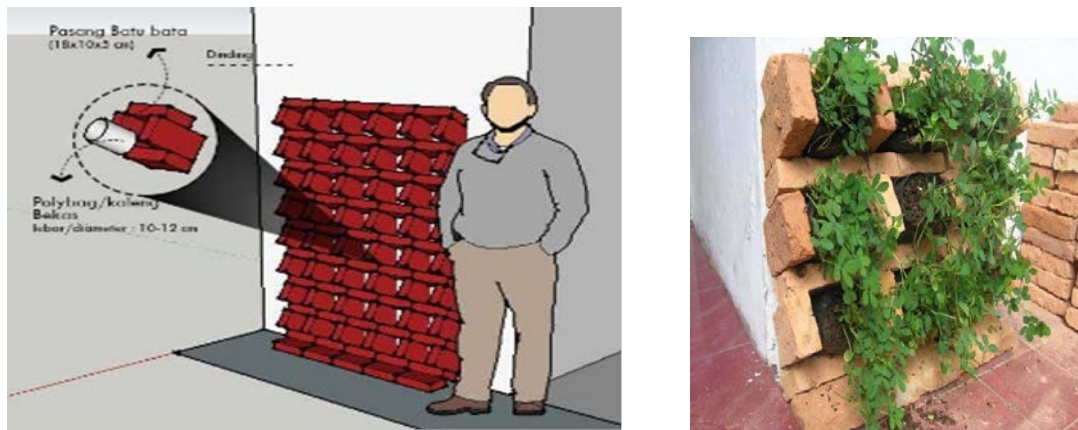
Gambar 5. Alternatif wadah tanam vertical ( vertical palnters ) batu bata