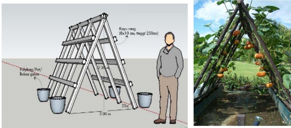
Gambar 7. Alternatif desain penanaman merambat