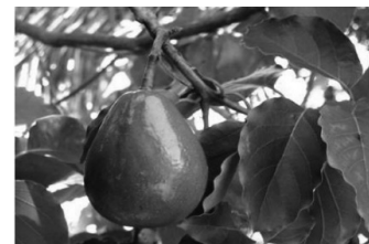
Gambar 1. Varietas Ijo Panjang Gambar 2. Varietas Ijo Bundar

kandungan total fenol antara alpukat varietas Ijo Panjang dan Ijo Bundar.