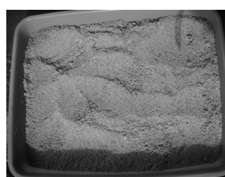
Gambar 4. Tepung alpukat Ijo Bundar