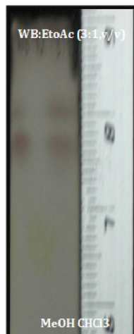
Gambar 1. Profil KLT ekstrak metanol (MeOH) dan kloroform (CHCl 3 ) T. diversifolia deteksi dengan reagen Serum sulfat