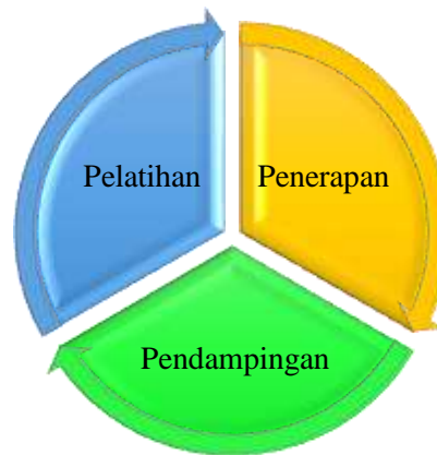
Gambar 1. Rangkaian Metode Kegiatan Pengabdian

Berdasarkan gambar diatas, penjelasan sesuai dengan langkah kegiatan ini adalah: