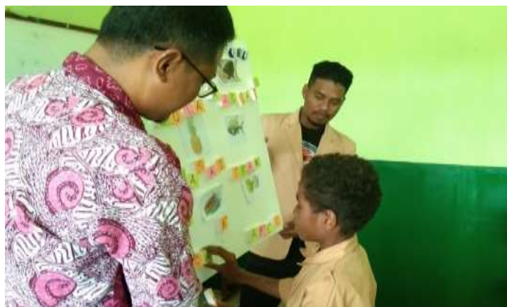
Gambar 3. Siswa belajar merangkai huruf menggunakan media kartu bergambar

dari tim PkM. Siswa menunjukkan sikap antusias yang tinggi dalam mengikuti kegiatan, ditandai dengan banyaknya siswa yang ingin tampil di depan kelas. Pada sela-sela kegiatan, guru juga ikut bertanya terkait dengan teknik merakit media yang digunakan, khususnya pada media berhitung seperti sempoa. Penggunaan media Calistung yang mudah dan murah menjadi daya tarik bagi guru mengikuti kegiatan PkM.