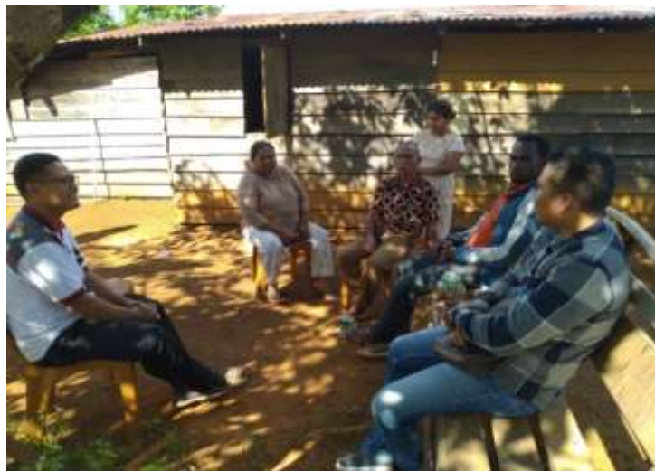
Gambar 1. Pertemuan dengan kepala kampung

tripleks, dan kertas. Adapun media Calistung yang digunakan adalah: sempoa, kartu huruf, kartu bergambar, buku calistung, kotak operasi hitung bilangan negatif, dan media tulis kata.