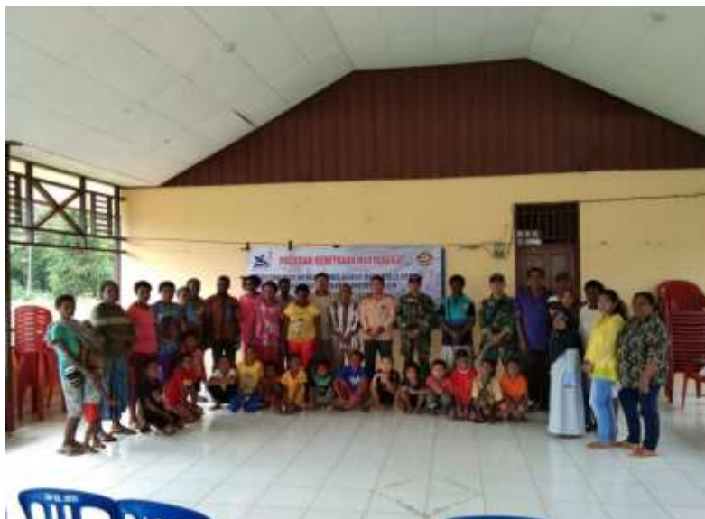
Gambar 4. Peserta pelatihan Calistung di balai kampung

Kegiatan pelatihan Calistung di balai kampung mendapatkan respon positif dari berbagai pihak termasuk prajurit TNI Satgas Pamtas di Kampung Baidub. Bentuk perhatian yang diberikan terhadap kelancaran kegiatan adalah dengan mengamankan seluruh rangkaian kegiatan.