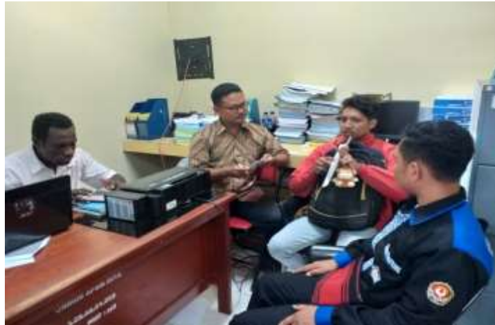
Gambar 2. Konsolidasi tim untuk kegiatan pelatihan Calistung

SD Inpres Bupul XII dan tanggal 23 Juni 2019 di Balai Kampung Baidub.