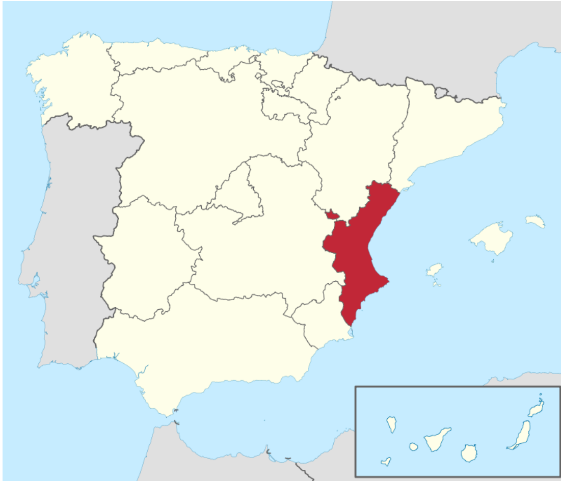
Imagen A1. Mapa de España con sus respectivas Comunidades Autónomas. La Comunidad Valenciana en rojo.