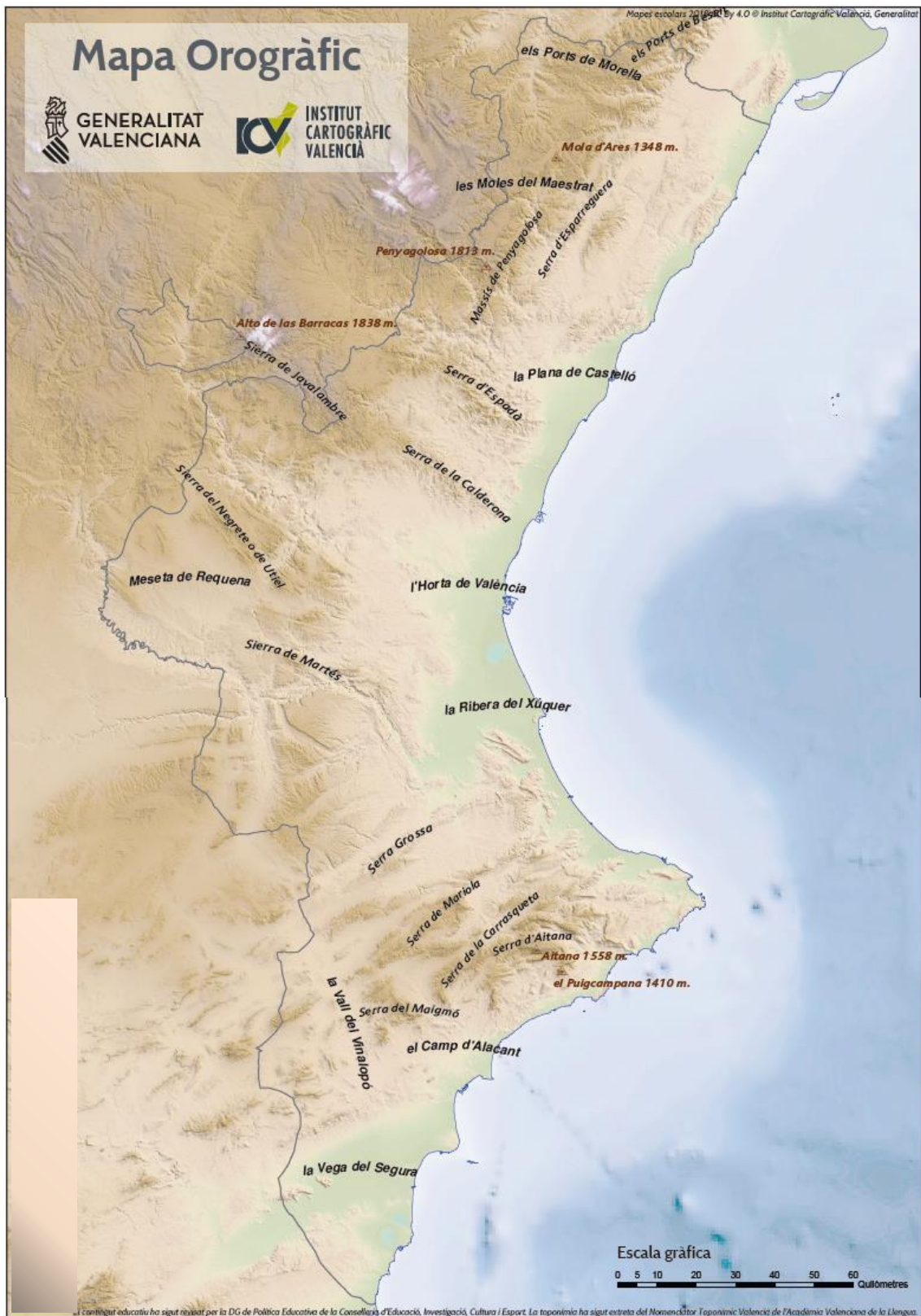
Imagen A2. Mapa Orográfico de la Comunidad Valenciana.