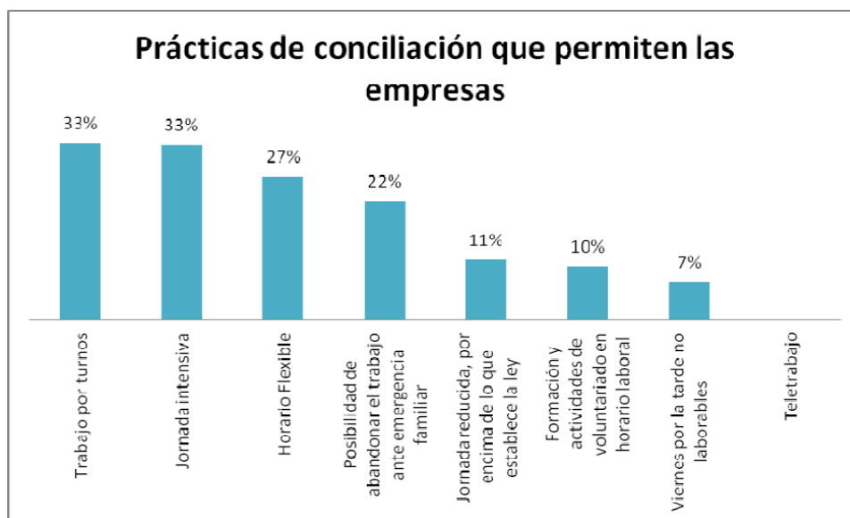
Figura 2: VI Informe #Monomarentalidad y Empleo. (Fuente: Gil, 2017)

establece la ley, la formación y actividades de voluntariado en horario laboral, los viernes por la tarde no laborables, y el teletrabajo. Este último es mencionado porque lo contempla Gil (2017), pero realmente no se da en las empresas. Las medidas predominantes son la implantación del trabajo por turnos y la jornada intensiva, seguido del horario flexible y la posibilidad de ausentarse por una emergencia familiar.