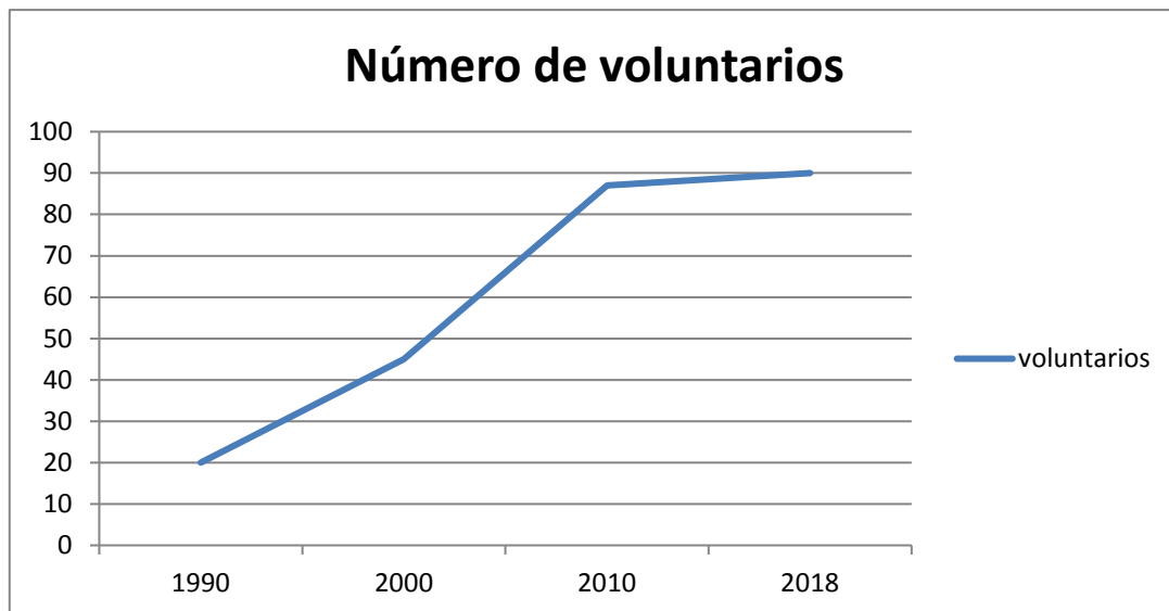
Gráfico 3: Elaboración propia