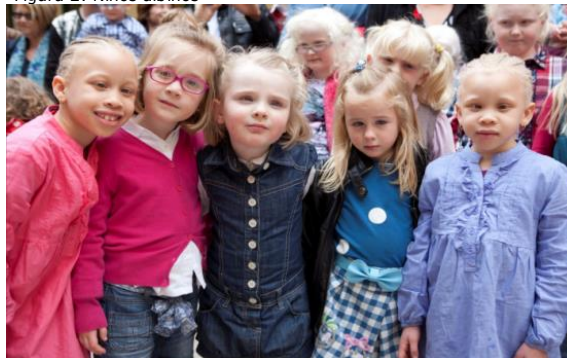
Figura 2: Niños albinos

En cuanto al aspecto físico, las personas con OCA2 casi siempre nacen con el cabello ligeramente pigmentado. El color del cabello al nacer o durante los primeros meses de vida puede variar de amarillo claro a rubio y marrón. La población africana nace con el cabello y la piel de color marrón claro (Figura 2).