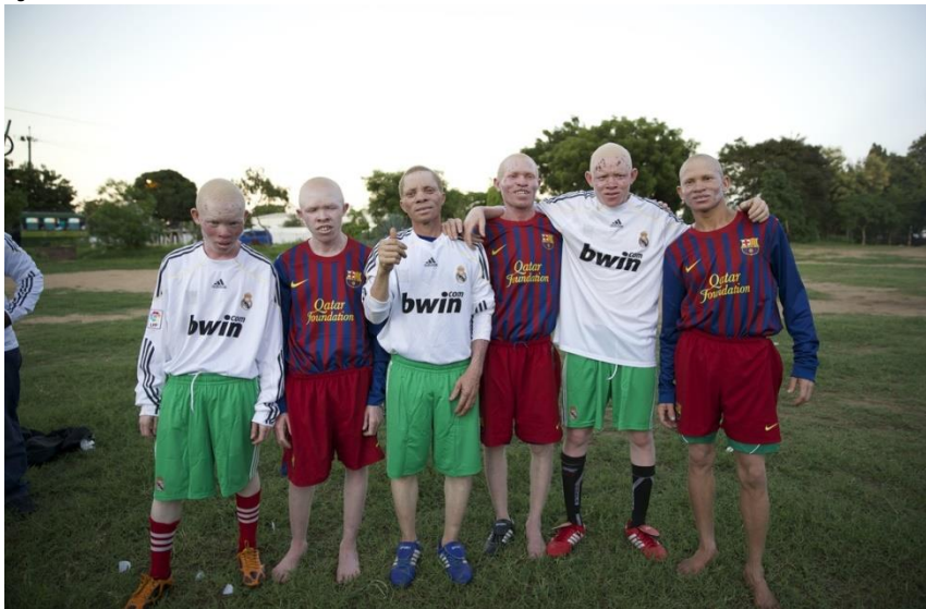
Colón JM. Albinos United - BMWS [Internet]. [citado 23 de abril de 2019]. Disponible en: https://www.blackmanwhiteskin.com/albinos-united.html