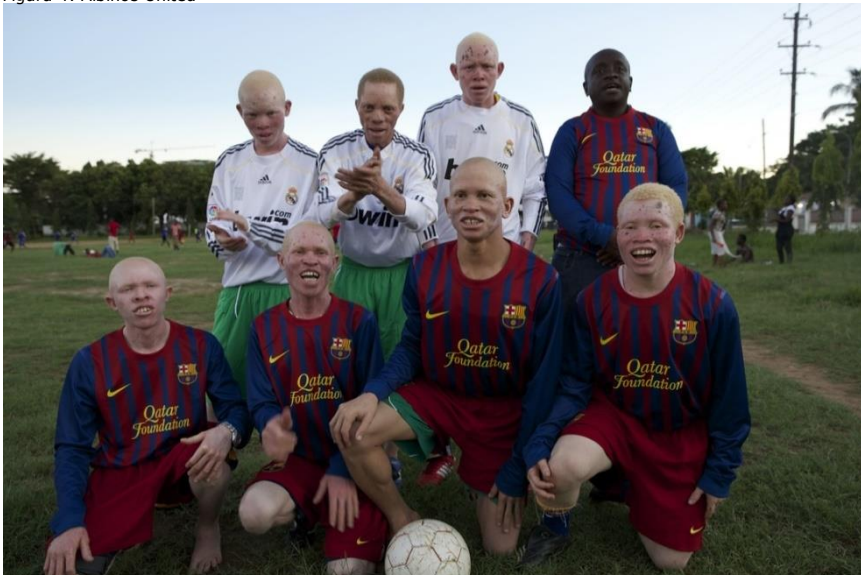
Colón JM. Albinos United - BMWS [Internet]. [citado 23 de abril de 2019]. Disponible en: https://www.blackmanwhiteskin.com/albinos-united.html