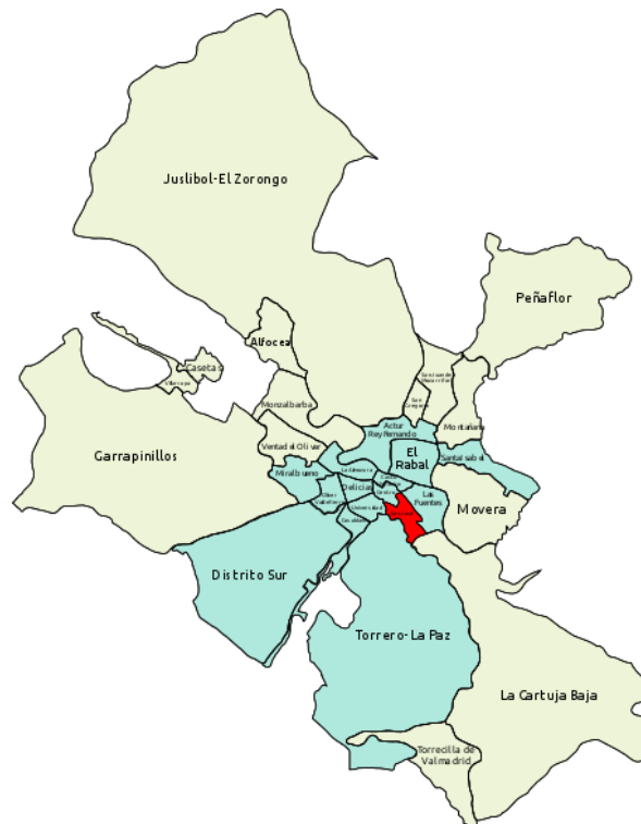
Figura 2. División del municipio de Zaragoza en distritos municipales y vecinales.

Así pues, el término municipal de Zaragoza lo componen dieciséis distritos municipales 15 : Centro, Casco Histórico, Delicias, Universidad, San José, Las Fuentes, Almozara, Oliver-Valdefierro, Torrero, Actur-Rey Fernando, El Rabal, Casablanca, Santa Isabel, Miralbueno y Distrito Sur (Figura1). Estas son las unidades territoriales del municipio de Zaragoza en las que se dividirá el presente estudio.