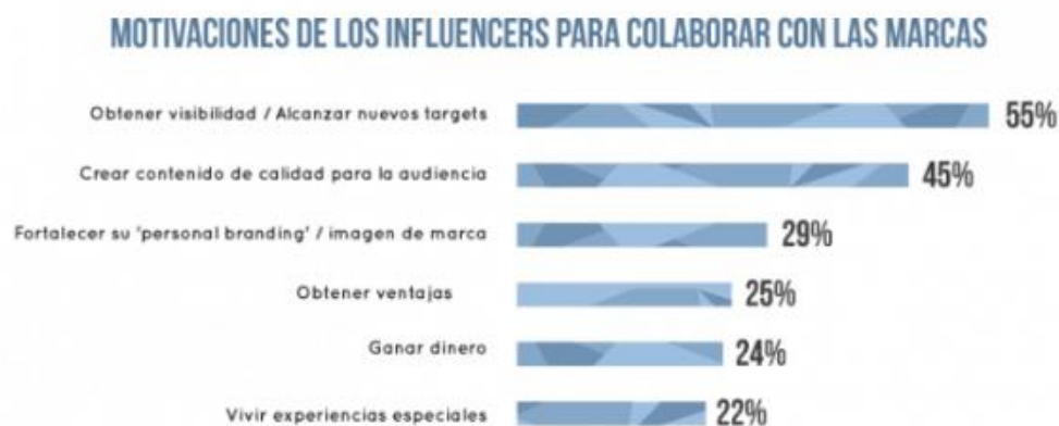
Gráfico 5: "Motivaciones de los influencers para colaborar con las marcas".

Basándonos en un estudio de Launchmetrics, la mayoría de los influencers aceptan las colaboraciones con las marcas para aumentar su visibilidad o mejorar la calidad de su contenido, no para enriquecerse.