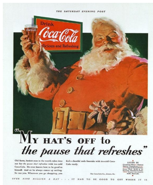
Ilustración 1: "Primera campaña marketing de influencia".

El origen del marketing de influencia se remonta a los años veinte. La marca Coca-cola, utilizó a un conocido personaje para que los consumidores recordasen los valores y las cualidades de la marca. La marca empleó la icónica figura de Papá Noel para dar soporte a una campaña en 1920, “The Saturdays Evening Post”. Su intención, utilizando el personaje creado por Thomas Nast, era transmitir su valor principal, la felicidad. A través de aquel entrañable hombre barbudo, vestido de rojo y blanco y que acostumbra a colarse por las chimeneas para dejar regalos a los niños, Coca-cola consiguió alinear dicha figura con su imagen de marca y valores.