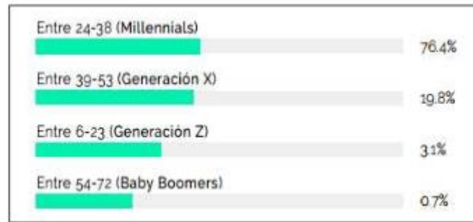
Gráfico 4: "Generaciones objeto del marketing de influencia".