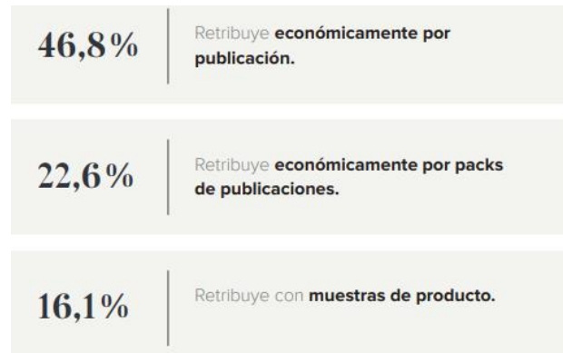
Gráfico 6: " Formas de retribución a los influencers por parte de las marcas."

publicaciones, no por una única publicación y por último en el 16,1% de las ocasiones remunera a los influencers a través de muestras de productos.