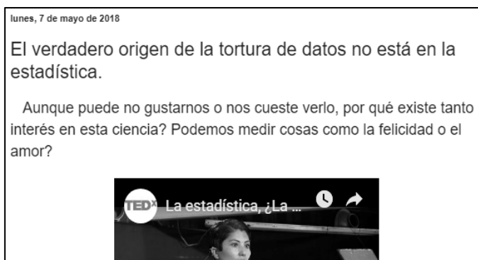
Imagen 7. Fragmento de la entrada: El verdadero origen de la tortura de datos no está en la estadística

Muchas de las entradas del blog son un ejemplo de cómo el alumnado adquiere capacidades para conocer y utilizar fuentes de información que le ayudarán a su formación a lo largo de la vida, y a su vez, a la oportunidad de dada una duda o problema, buscar su solución y aprender de manera autónoma. Una entrada es: El verdadero origen de la tortura de datos no está en la estadística (una parte está en la Imagen 7).