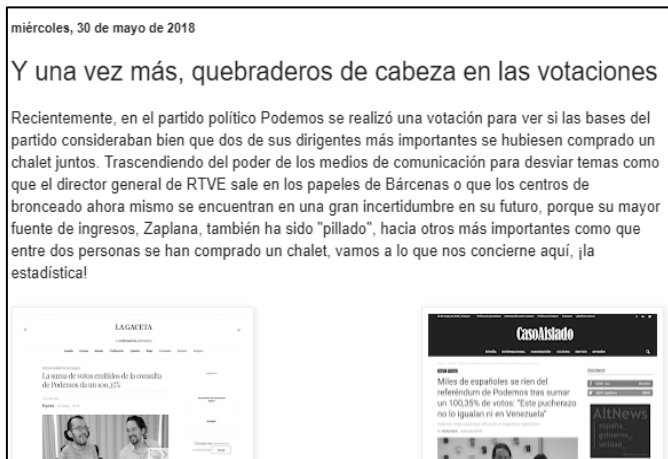
Imagen 6. Fragmento de la entrada: Y una vez más, quebraderos de cabeza en las votaciones