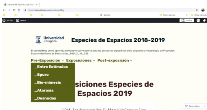
Figura 1. Captura de pantalla del blog. Pestaña Pre-exposición desplegada.

La acción docente se desarrolla a través de un seguimiento -clases teóricas, de taller y tutorías de grupo y personalizadas-, un análisis del desarrollo y resultados, la observación continua, puestas en común... La metodología es la de aprendizaje por proyectos, y, si además sus resultados son comunicados y visibilizados de modo público, resulta muy útil para la futura vida profesional de los estudiantes, siendo esto transferible a cualquier área de conocimiento.