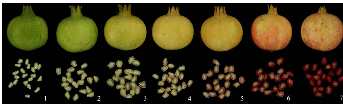
Figura 1. Apariencia de las frutas intactas y arilos en cada recolección.

Los espectros medios de las frutas intactas y los arilos en cada recolección se presentan en la Figura 2. Los espectros mostraron tendencias similares para las frutas intactas y los arilos, pero la intensidad en la reflectancia es diferente en cada recolección. Esto significa que poseen constituyentes similares pero en diferente concentración. En el caso de las frutas intactas, estas diferencias en la intensidad de reflectancia se ubicaron alrededor de 720-750 nm cerca del pico de absorción de clorofila, 680 nm, y el valle presente en la región 960-990 nm, principalmente asignado a las bandas de absorción de agua. Este valle fue más pronunciado en la fruta más madura porque el contenido de agua aumenta en los tejidos durante el inicio de la maduración, debido a la rotura celular y al movimiento osmótico del agua [15].