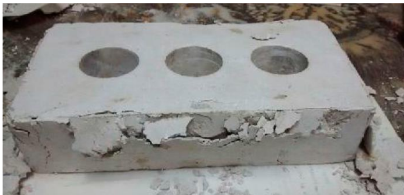
Figura 1. Ladrillo tipo de yeso ensayado.

Con relación al estudio energético. Se evalúa el proceso de fabricación del ladrillo de yeso aditivado comparándolo con el cerámico perforado.