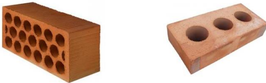
Figura 3: Ladrillos semimacizos de arcilla.

Un ladrillo cerámico de similares características, cierra su resistencia mecánica en valores de 10 N/mm 2 ; como se observa, valores muy inferiores a los obtenidos en los ensayos.