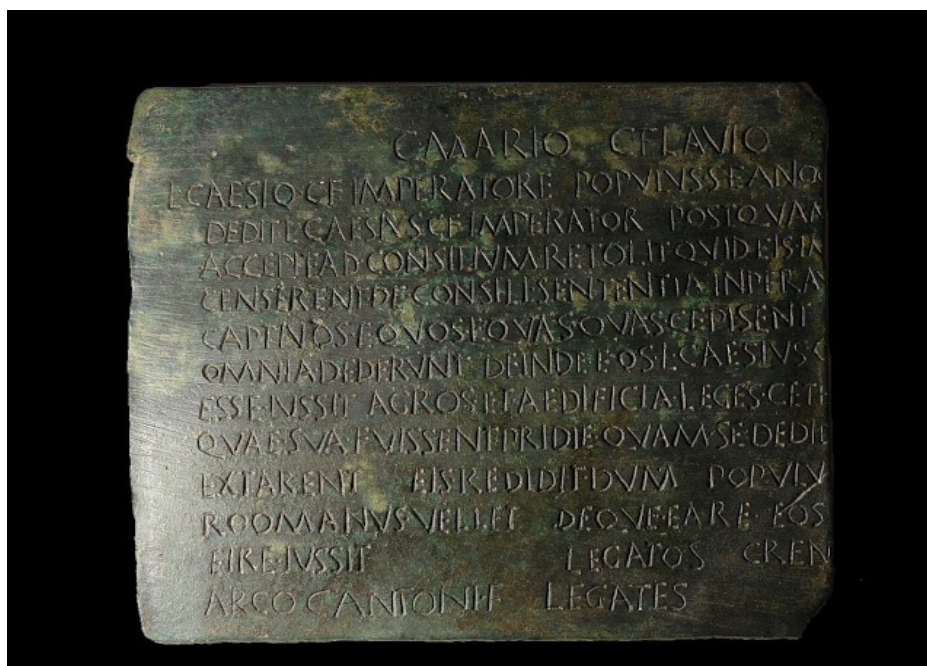
Figura 2. Imagen del bronce de Alcántara 143

La pieza fue hallada en el 1893 d.C en el Castro de Villaveja dentro de la dehesa del Castillejo de la Orden. Todo esto pertenece al término municipal de Alcántara (Cáceres). Se trata de una pieza de bronce que es legible pese a la pérdida de un trozo en la parte derecha. Actualmente se encuentra en el Museo de Cáceres. Su medidas son 21'5 x (19'3) x 0'4 cm con unas letras hechas por incisión de entre 0'8/1 cm cuya interpunción es circular 142 .