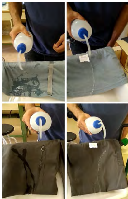
Figura 2: Probando a mojar los textiles sin impregnar e impregnados en aerosol.

La S1 comienza con la presentación (E0) de la actividad en la que se informa al alumnado sobre la metodología de indagación guiada que van a seguir y los objetivos de esta propuesta. Seguidamente (E1), se muestra un vídeo donde el docente añade un aerosol a distintos textiles. Esto se hace mediante un vídeo, ya que una vez aplicado el aerosol, hay que esperar cierto tiempo para lograr el efecto deseado, por lo que no es posible hacerlo en la propia sesión, sino que hay que hacerlo previamente. A continuación, el profesor vierte agua y ketchup a los mismos textiles que aparecen en el video, con y sin aerosol para poder observar las diferencias (ver Figura 2).