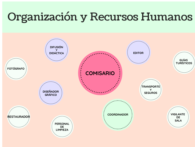
Fig.3. Gráfica de Recursos Humanos de la exposición Redescubriendo el Monasterio Jerónimo de Santa Engracia

Para la puesta en marcha de la exposición contaremos con una serie de profesionales de distintas disciplinas que trabajarán en equipo para poder llevarlo a cabo y que los resultados sean lo más satisfactorios posibles [fig.3].