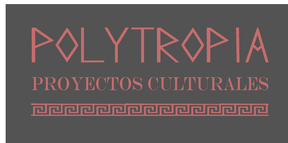
Fig.2. Logo de la empresa Polytopia Proyectos Culturales

El proyecto de la exposición Redescubriendo el Monasterio Jerónimo de Santa Engracia de Zaragoza está realizado por la empresa Polytropia 29 Proyectos Culturales [fig.2], y para poder llevarlo a cabo buscaremos el patrocinio del Gobierno de Aragón y del Ayuntamiento de Zaragoza, además de la participación de la Parroquia de Santa Engracia.