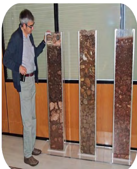
Figura 2: Monolitos de suelos mostrando los diferentes horizontes en cajas de metacrilato