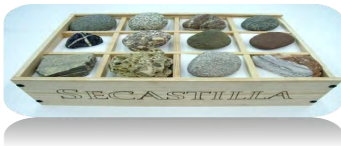
Figura 1: Caja de rocas representando los diferentes orígenes geológicos de los suelos de Secastilla