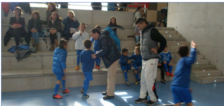
► Figure 4. Families get their children ready to start warming up for a game

Los padres esperan a sus hijos a la salida del colegio, les dan la merienda, la ropa del fútbol, les ayudan a cambiarse para realizar el entrenamiento y les esperan para recogerles hora y tres cuartos después dos días a la semana (28/10/2014). (Figure 4)