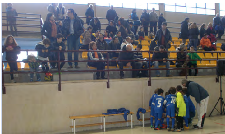
Figure 2. “War cry” of the team before beginning the game before relatives and close friends

La identidad del equipo fomenta el desarrollo de una competencia para la defensa a ultranza de la solidaridad interna y los intereses de sus miembros, donde los protagonistas y foco de atención son los jugadores. (Figura 2)