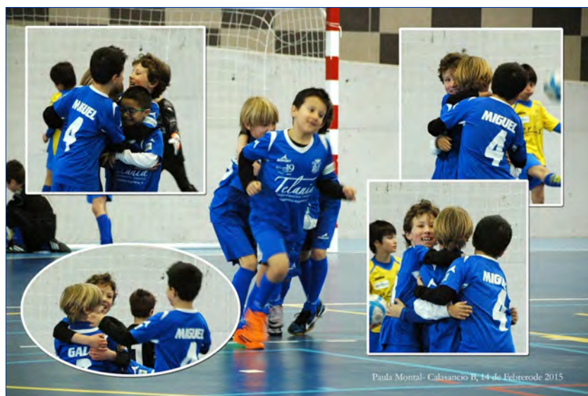
► Figure 3. Goal celebrations by the starting line-up.

La cooperación facilita la complicidad, un vínculo afectuoso que poseen los miembros con más afinidad. Se media para que se cree un clima de amistad entre los jugadores: comidas, cumpleaños, regalos para todos... (Figura 3)