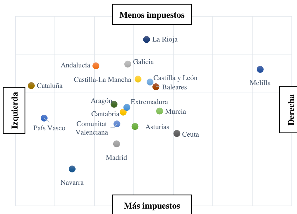
Figura 3: Posición media de los encuestados en el eje izquierda-derecha (1 a 10) y en el de a favor de pagar más impuestos o menos impuestos (0 a 10) por Comunidad Autónoma