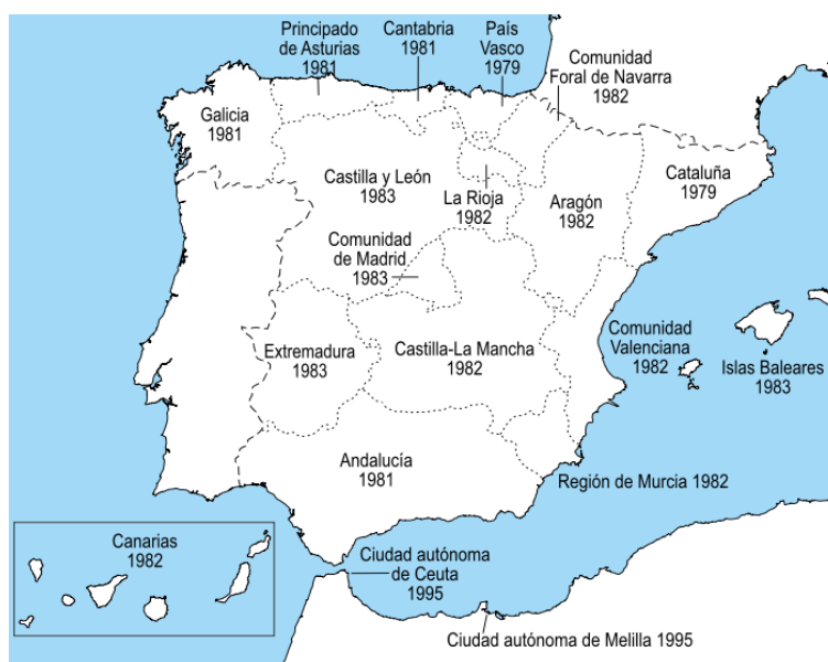
Figura 1: Mapa político de España con los años de aprobación de los estatutos de autonomía