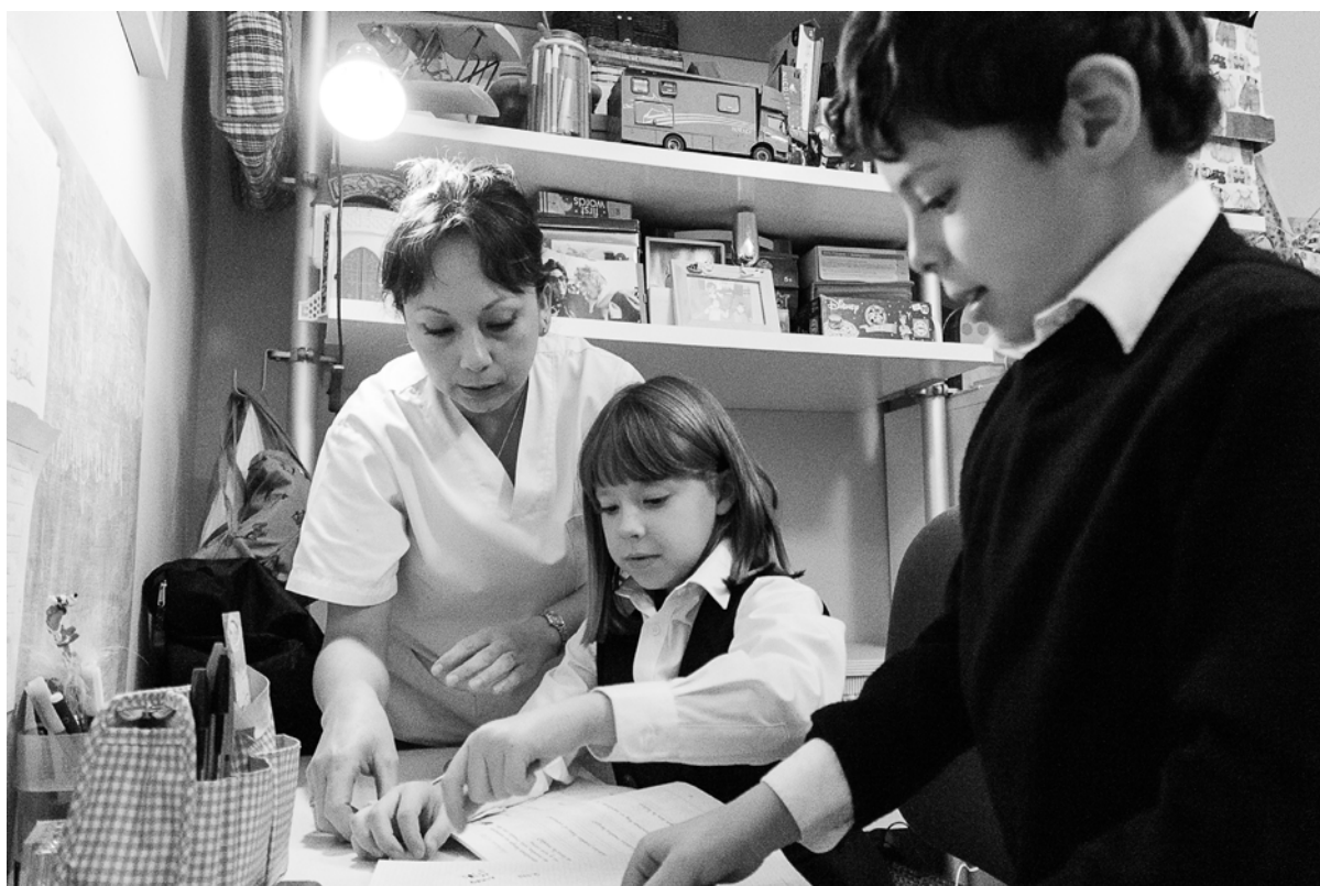
Figura 3. Guatemalteca, empleada de hogar y cuidadora. Haciendo los deberes escolares con los niños que cuida.

Muchas de ellas expresan el deseo de permanecer en España mientras tengan un trabajo, esto supone mantener relaciones transnacionales con su familia (hijos, padres, hermanos, esposos), Esta decisión está íntimamente relacionada con las condiciones laborales que tienen, aunque han obtenido el permiso de trabajo, la crisis económica que azota a España desde 2008, ha hecho que el empleo de los cuidados se concentre en la modalidad de interna, con lo cual la posibilidad de vivir en familia se desvanece por completo (Hernández, 2016).