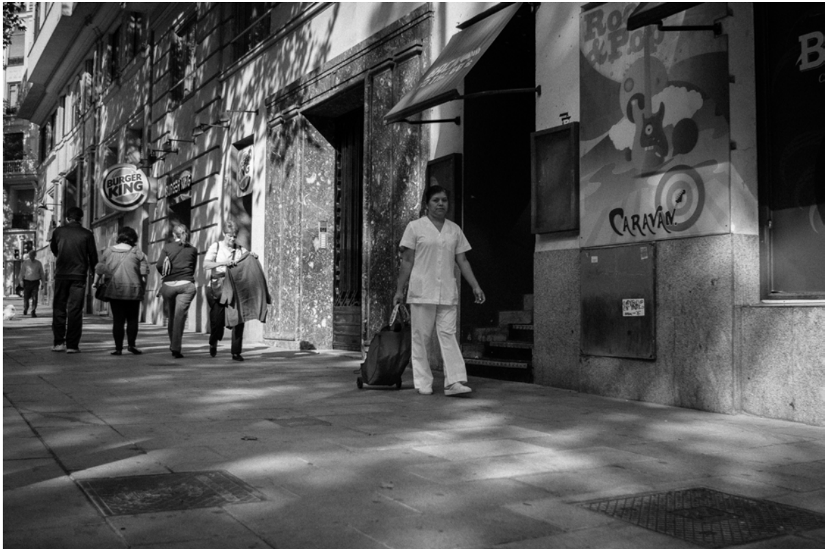
Figura 2. Guatemalteca, empleada de hogar y cuidadora, haciendo la compra de supermercado.

económicas, es decir, que se trata de una migración que responde a la demanda de mano de obra en el mercado de los cuidados (Gregorio, 1998; Parella, 2003).