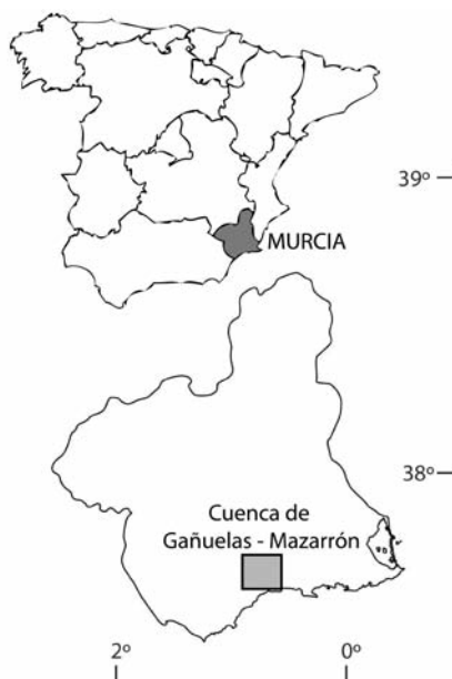
Fig.1.- Localización de la zona de estudio.

Geológicamente el acuífero se sitúa en la Zona Interna de la Cordillera Bética, en la cuenca terciaria de Gañuelas-Mazarrón (Fig. 1). El basamento de esta zona está constituido por materiales paleozoicos y triásicos de los Complejos Nevado-Filábride, Alpujarride y Maláguide (Cerón et al. , 2000). El relleno neógeno de la cuenca está constituido por conglomerados, margas, margocalizas, margas con yesos y areniscas. Durante el Mioceno estos materiales neógenos fueron