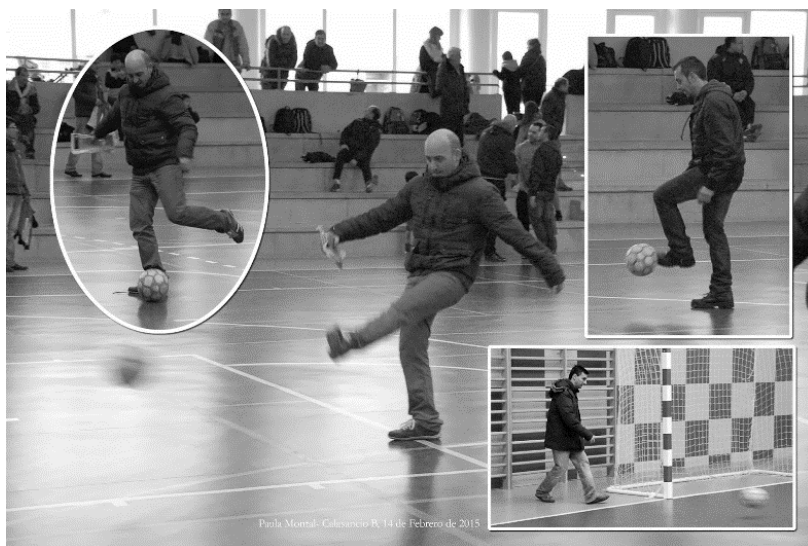
Figura 3. Padres practicando fútbol entre partido y partido.

Implicación. Participación económicamente desinteresada del adulto en el equipo de su hijo para que éste funcione, invirtiendo su tiempo e ilusiones en el escenario de fútbol prebenjamín.