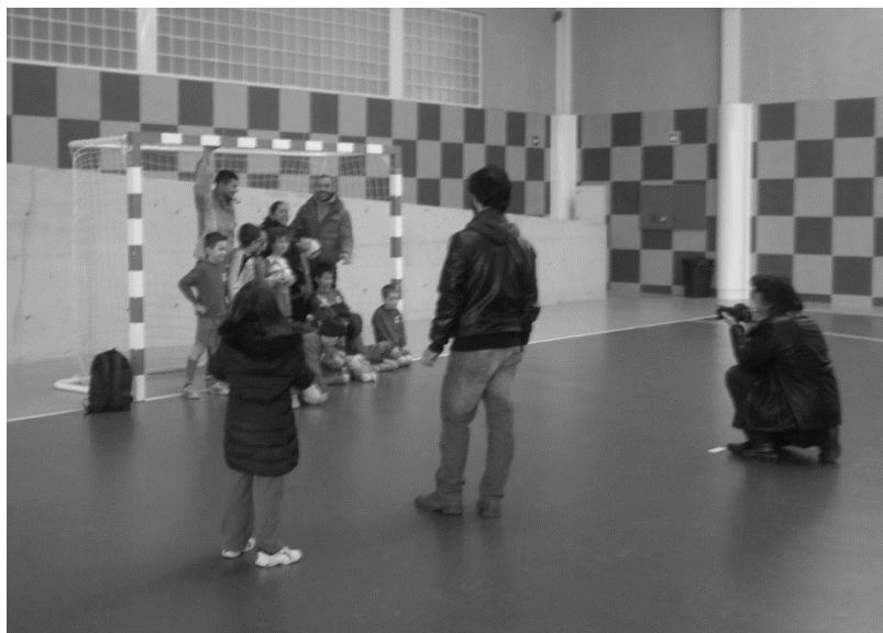
Figura 1. Familias se acercan para realizar unas fotografías del equipo, donde se incluyen familiares.

Aunque "X" e "Y" fueron los premiados individualmente fue, sin lugar a dudas, la actuación de todo el equipo la que coadyuvó a la consecución de este éxito deportivo. ¡Enhorabuena a todos! (Blog: 8/12/14).