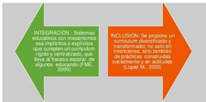
Ilustración 2. Diferencias entre Integración e Inclusión Educativa