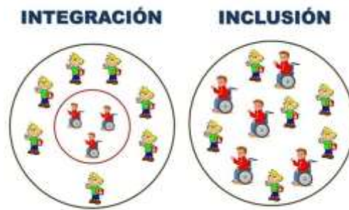
Ilustración 1. Diferencia entre integración e inclusión