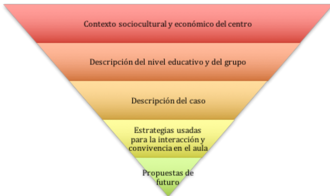
Ilustración 1 Estructura de la experiencia

En cada apartado se exponen los documentos que han servido para lograr el correcto desarrollo de la propuesta planteada. Se debe exponer, que dicha práctica se ha realizado un año después de la realización del Máster de Educación con un equipo de fútbol-sala, organizado por el PIEE del IES Elaios de Zaragoza, por lo tanto mucha documentación realizada tales como los Prácticums difiere a lo encontrado a lo largo de esta situación. El caso, en su origen parte de la educación no formal , aunque se extrapola los conocimientos obtenidos en el Máster para lograr una correcta educación en valores, la integración de los componentes del equipo, logrando una fuerte cohesión e intentar llegar lo más lejos posible durante la temporada participando todos los miembros del equipo y como Graduado de Ciencias de la Actividad Física. En el anexo 2 se indican los módulos de los que se compone el Máster en Profesorado en Educación Física.