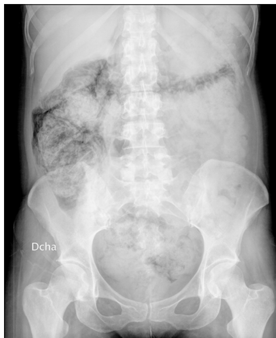
Figura 1. Radiología simple de abdomen.

Esta entidad se ha asociado con una enorme variedad de condiciones clínicas y se puede presentar en cualquier parte del tracto gastrointestinal; Tiene