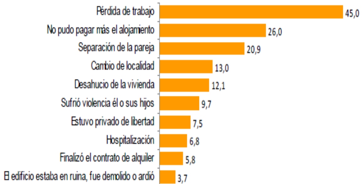
Tabla 2. Personas sin hogar por los motivos por los que se quedaron sin hogar