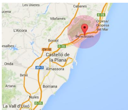
Imagen 2: Localización FIB