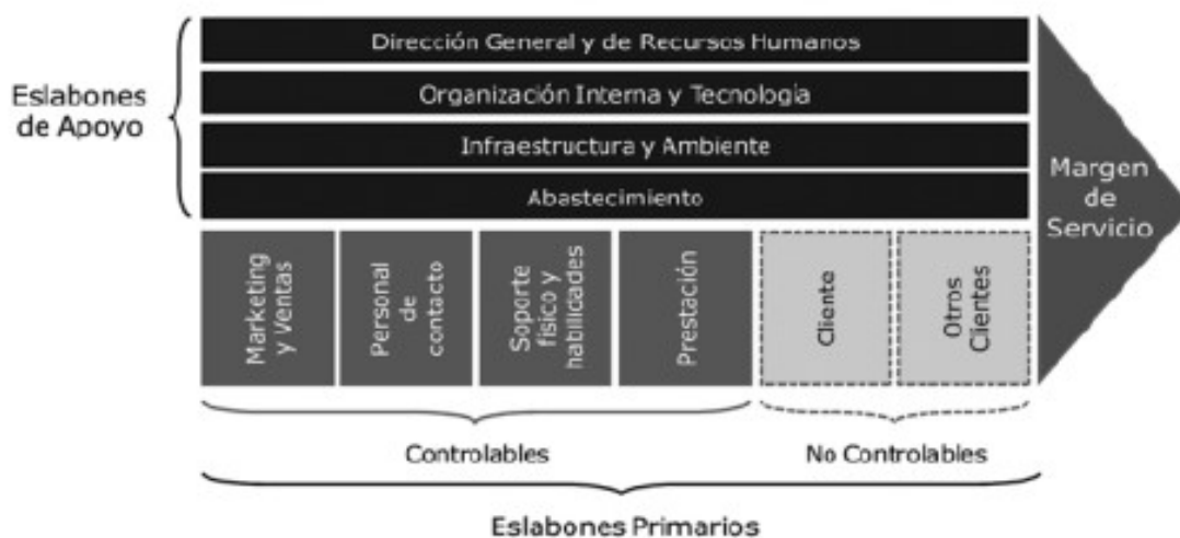
Ilustración 6. Cadena de valor en el sector servicios.