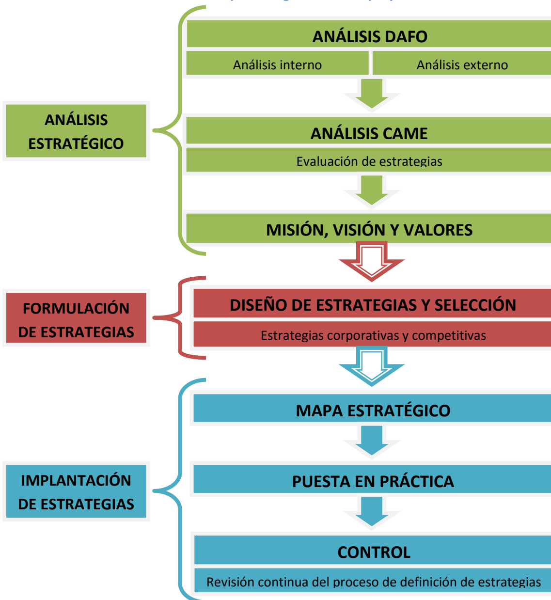
Ilustración 2. Esquema organizativo del proyecto.

Para estudiar la empresa correctamente seguiremos el siguiente esquema: