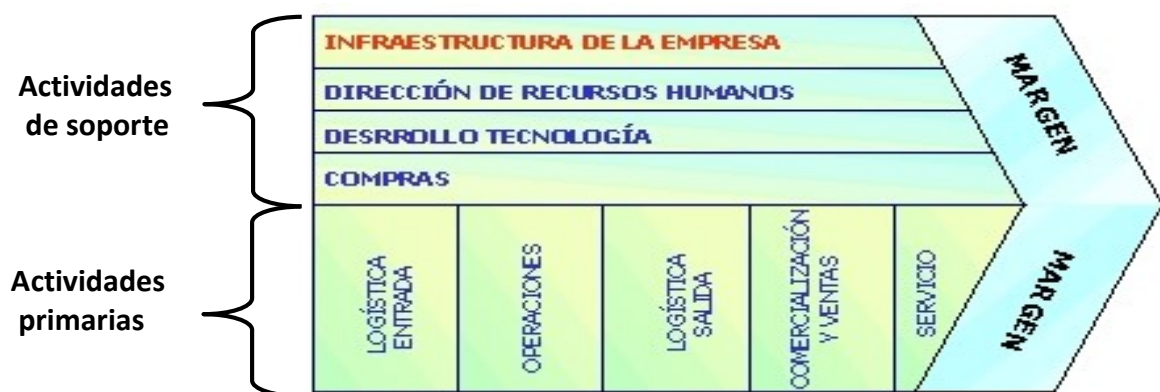
Ilustración 5. Cadena de valor de M. Porter.

Esta perspectiva está muy ligada a la cadena de valor, a través de la cual se podrán descubrir las necesidades y los problemas de la empresa. Así mismo, podremos detectar las actividades necesarias para alcanzar los objetivos que hemos estudiado en las dos perspectivas anteriores. Es por esto que esta es una de las perspectivas más importantes del mapa estratégico. La cadena de valor fue introducida por Michael Porter en 1985 e integra todas las actividades empresariales que generan valor a una empresa.