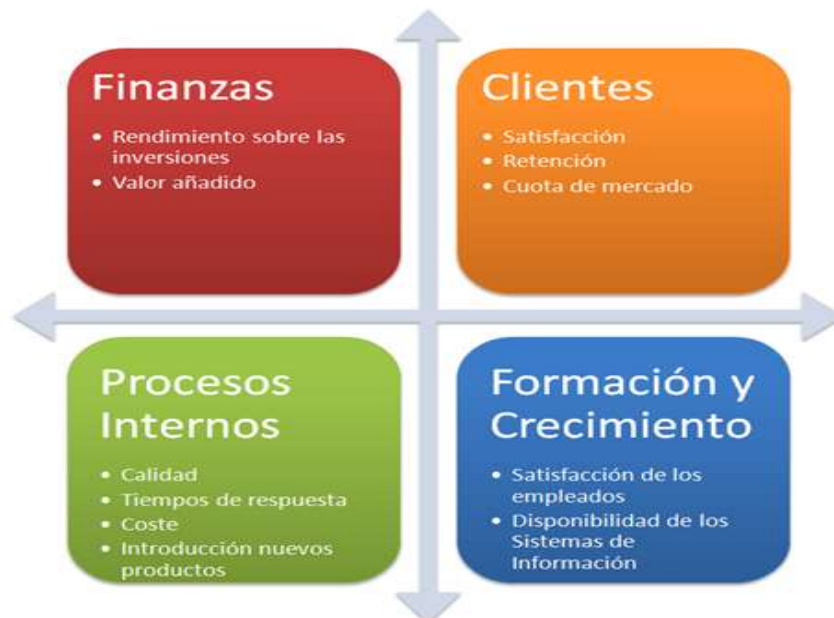
Ilustración 1. Perspectivas del Cuadro de Mando Integral.

Como vemos, los objetivos se basan en mejorar las cuatro perspectivas utilizadas en el CMI: Perspectiva financiera, clientes, procesos internos, y aprendizaje y crecimiento.