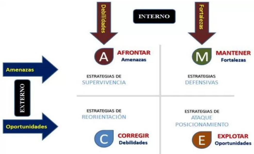
Ilustración 4. Análisis CAME