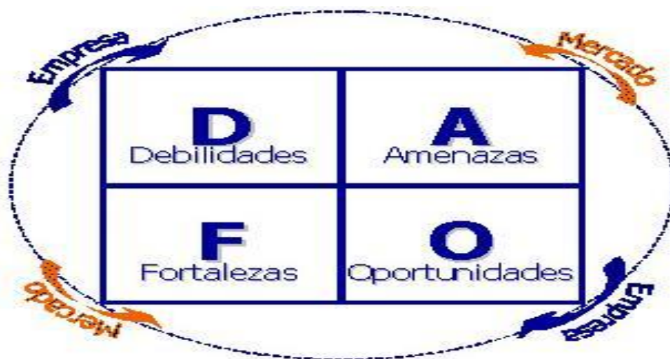
Ilustración 3. Análisis DAFO

El análisis DAFO es una forma de estudiar la situación de una empresa, analizando así tanto los factores internos, los cuales dependen de la propia empresa, como los factores externos, los cuales dependen del mercado en el que se opera. Este análisis ayuda a las empresas a determinar las ventajas competitivas y a planear una estrategia empresarial de futuro.