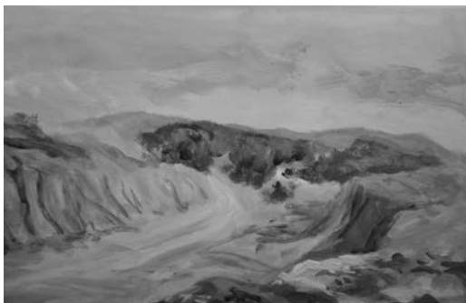
Figura 5. Uno de os trabajos del alumnado en el Parque de las arcillas, Teruel, 2014. Óleo sobre tabla, 30x40 cm.

La experiencia siempre es positiva para el alumnado, de hecho, es raro el absentismo en este tipo de actividades al aire libre. La predisposición por parte del alumnado es total, a pesar de la incomodidad que supone acarrear los bártulos necesarios para la actividad práctica, pues los caballetes de campo, pinturas, lienzos o tablillas no son fáciles de transportar.