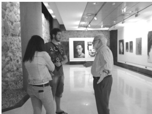
Figura 7: Sala de Exposiciones de La muralla, Edificio Carmelitas. Exposición EGO, 2014.

El resultado final fue totalmente satisfactorio y tuvo repercusión en la prensa local. La calidad del trabajo presentado era excelente, sobre todo teniendo en cuenta que la mayor parte de los participantes eran alumnos de segundo curso. La dedicación que prestaron a este ejercicio en el aula (la ejecución material de sus autorretratos) fue extraordinaria incentivados por la idea de una muestra posterior. La gestión y coordinación que llevaron a cabo fuera del aula se valoró por mi parte muy positivamente como profesora de la asignatura y fue tenida en cuenta para la evaluación de los resultados de aprendizaje.