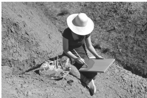
Figura 3. Alumna en el Parque de las Arcillas, Teruel, 2015.