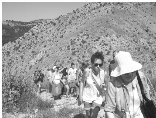
Figura 1. Alumnos del I Curso de Pintura Miradas y Territorio. Subida al castillo de Alcalá de la Selva (Teruel, 2011)

“En estas excursiones se atiende al desarrollo físico de los alumnos por medio de largas caminatas, ascensiones y ejercicios varoniles que dan vigor al cuerpo, al mismo tiempo que energía moral y temple al alma; estudian directamente los objetos naturales y el territorio como teatro vivo de la actividad humana (...)” (Torres Campos, 1882: 188).