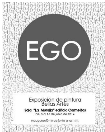
Figura 6. Cartel de la exposición EGO de alumnos de Bellas Artes, 2014.

Gestionar, diseñar y montar una exposición con los trabajos realizados durante el curso, o con el resultado de un trabajo determinado de una o más asignaturas se convierte en un recurso didáctico cada vez más necesario. A continuación describiré la experiencia llevada a cabo por los alumnos de segundo, tercer y cuarto curso en torno a una exposición que tuvo como tema el autorretrato. Dicha exposición titulada EGO , se celebró en la Sala de Exposiciones de La Muralla del Gobierno de Aragón, en el centro de Teruel, en la primavera de 2014.