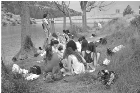
Figura 2. Alumnos del III Curso de Pintura Miradas y Territorio. Descanso en el pantano de Rubielos de Mora (Teruel, 2015)

Hoy en día abunda la bibliografía referida al paisaje como experiencia estética derivada de la observación y la experimentación directa mediante el acto físico de andar. Arquitectos, artistas plásticos, poetas y filósofos coinciden en valorar el paseo como hecho indispensable para definir la idea de paisaje.