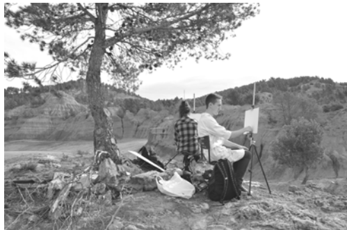
Figura 4. Alumnos en el Parque de las Arcillas, Teruel, 2015.

Un mismo espacio es percibido por cada persona de modo diferente, porque como dije al principio el paisaje es el conjunto de estímulos, sentimientos y vivencias que cada individuo experimenta en el lugar.