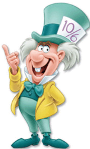
Figura 6: Sombrero