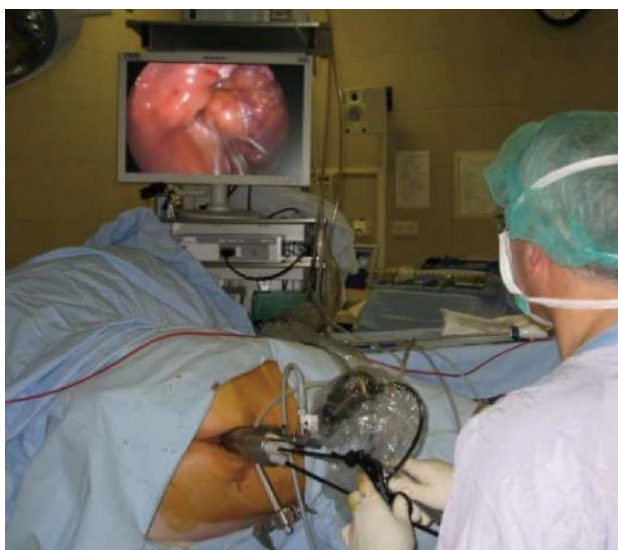
FIGURA 1: Plataforma TEM en el canal anal [2]

Después de la inserción del rectoscopio la lesión es identificada y el rectoscopio se fija en la posición en la que hay una óptima visualización y