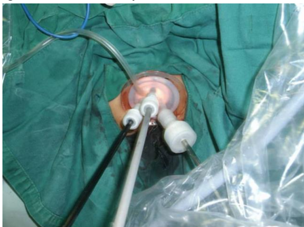
FIGURA 3: Puerto SILS para cirugía transanal [24]

También se están utilizando los puertos de única incisión laparoscópica para realizar cirugía transanal. Permite la aplicación del enfoque TEM a cirujanos con experiencia en el SILS abdominal, ya que difiere poco de esta. Los resultados en cuanto a seguridad son igual a los del TEM y TAMIS. [23]