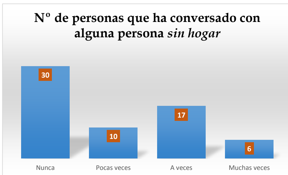
Tabla 3: Cuestionario posterior ¿Te has parado a conversar alguna vez con una persona sin hogar?

La tabla 3 refleja las creencias en torno a las causas que conducen a las personas a la calle. Destaca el hecho de que la mayoría de los estudiantes considera que las principales causas que conducen a la calle están relacionadas con las adicciones o las drogas. De nuevo se pone de manifiesto el hecho de que uno de los orígenes asociados a las personas sin hogar se encuentre bajo sus responsabilidades/culpabilidad, causa con connotaciones claramente negativas.