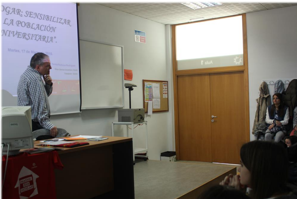
Imagen 2 y 3 Desarrollo del proyecto de intervención #Calle0