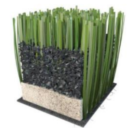
Fig. 1 Sistema Sin Sub-base