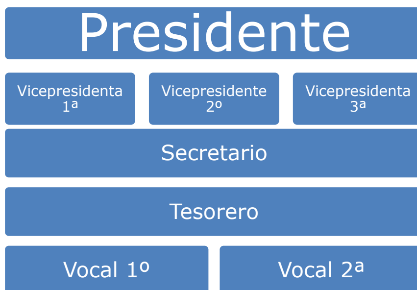
Ilustración 1. Elaboración propia