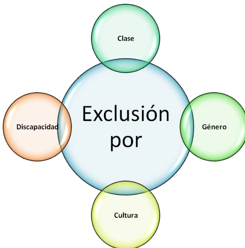
Figura 1. “Santisima Trinidad” + Discapacidad

Slee (1997) (cit. Parrilla, A) denomina “la Santísima Trinidad” para explicar y abordar el tema de la exclusión en la escuela, a través de factores como el género, cultura y clase. Pero fue en la Educación Especial, donde se comenzó a hacer conciencia sobre el proceso de inclusión. Así que yo uniría a la “Santísima Trinidad” de Slee el factor de discapacidad y así tendríamos los principales motivos por los que los alumnos son discriminados.