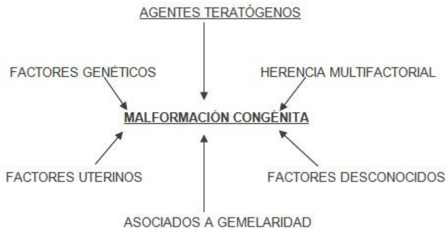
Figura 2.3.1: Etiología de las malformaciones congénitas

En la etiología de las malformaciones congénitas pueden actuar tanto factores genéticos como ambientales. El 10% presentan un origen genético (anomalías cromosómicas, genes mutantes únicos, casos familiares), el 23% por herencia multifactorial, el 3,2% producidas por agentes teratógenos, el 2,5% debidas a factores uterinos, el 0,4% asociadas a gemelaridad y el resto de etiología desconocida 2 .