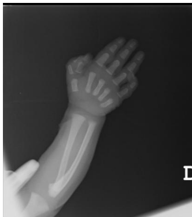
Figura 7.2.1.: Radiografía de paciente en la que se observa polidactilia del primer dedo de la mano izquierda.

Tres pacientes presentaron ectrodactilia.