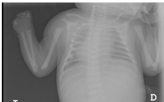
Figura 7.2.2.: Radiografía de RN en la que se observa ectrodactilia.

Tres pacientes presentaron ectrodactilia.