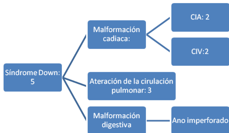
Figura 7.2.1: Malformaciones presentadas de los RN vivos con S.de Down

Algunas de las malformaciones que padecían los recién nacidos con síndrome de Down estaban asociadas. Tres de ellos presentaba malformación cardíaca y en uno de ellos estaba asociado CIV con CIA.