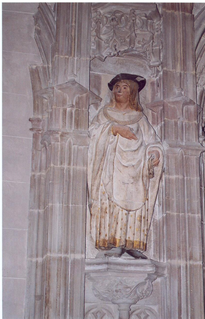
Estatua que jalona la entrada al claustro.