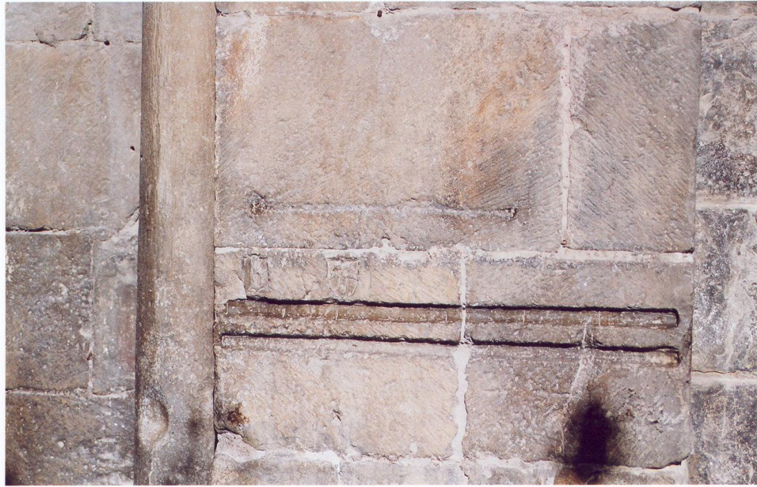
Patrones de medidas de longitud usadas en el mercado jacetano. Lonja menor de la Catedral de Jaca.